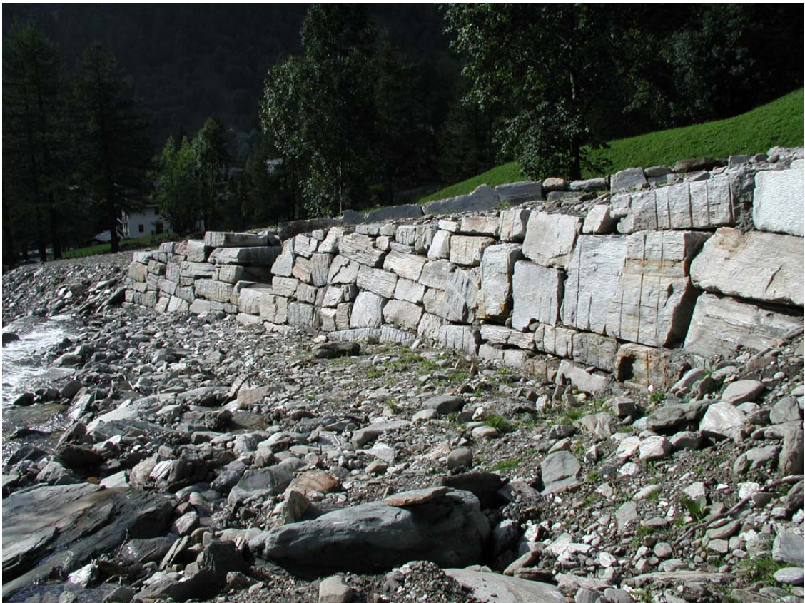
Foto 014 – Opera BATTDS014 . In corrispondenza dell'opera, in sponda destra del Rio d'Envie.