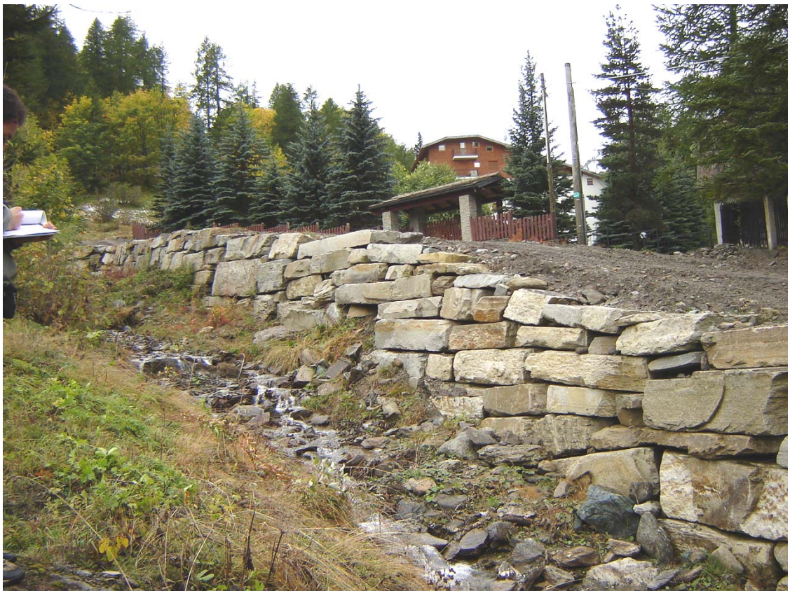
Foto 043 – Opera BATTDS044 . Ripresa da valle, sponda destra del rio affluente destro del T. Germanasca.