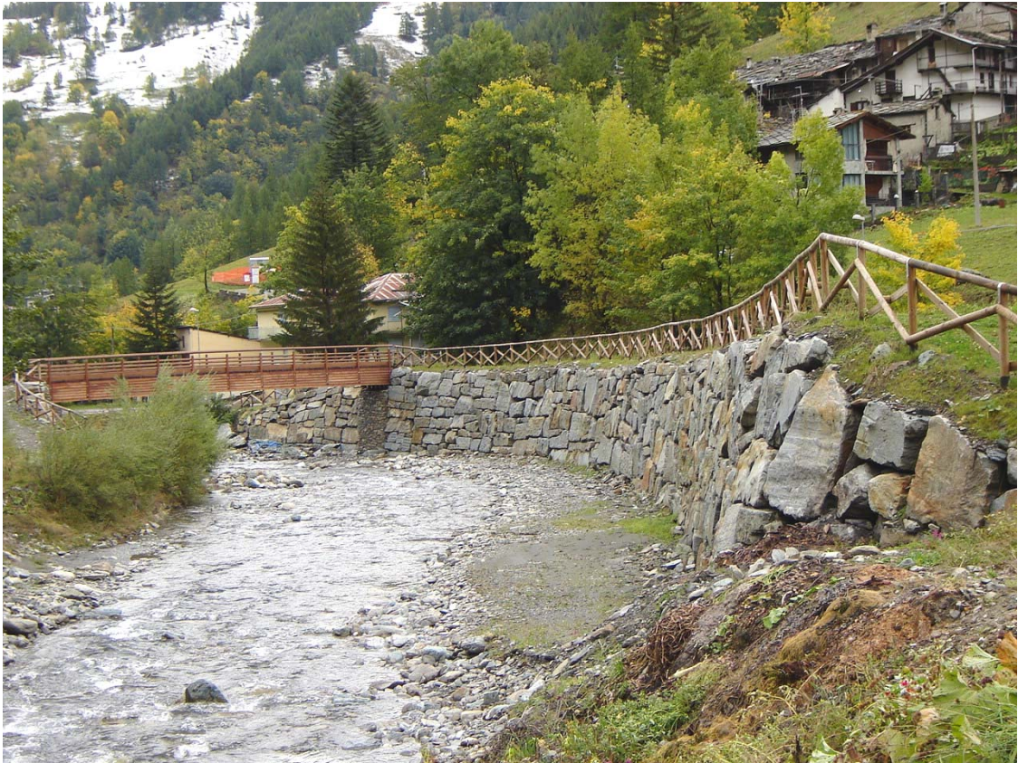
Foto 037 – Opera PENNDS039 . Ripresa da valle, sponda destra del T. Germanasca.