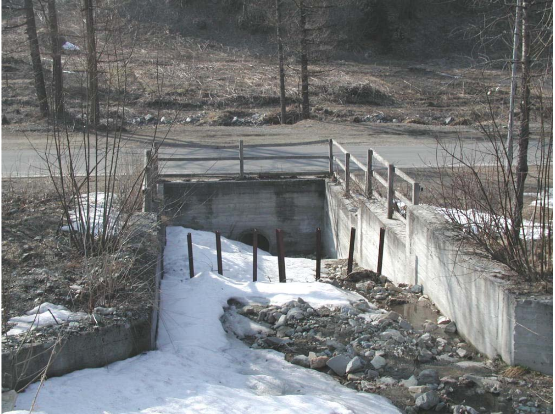
Foto 006 – Opera BATTAG012 . Da monte, in corrispondenza dell'alveo dell'affl. Del T. Germanasca.