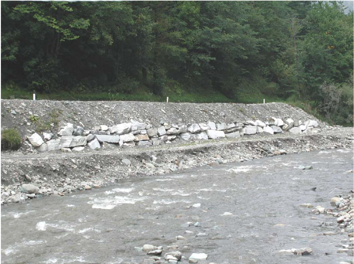
Foto 017 – Opera TREVDS017 . Da monte, sponda destra del T. Germanasca.