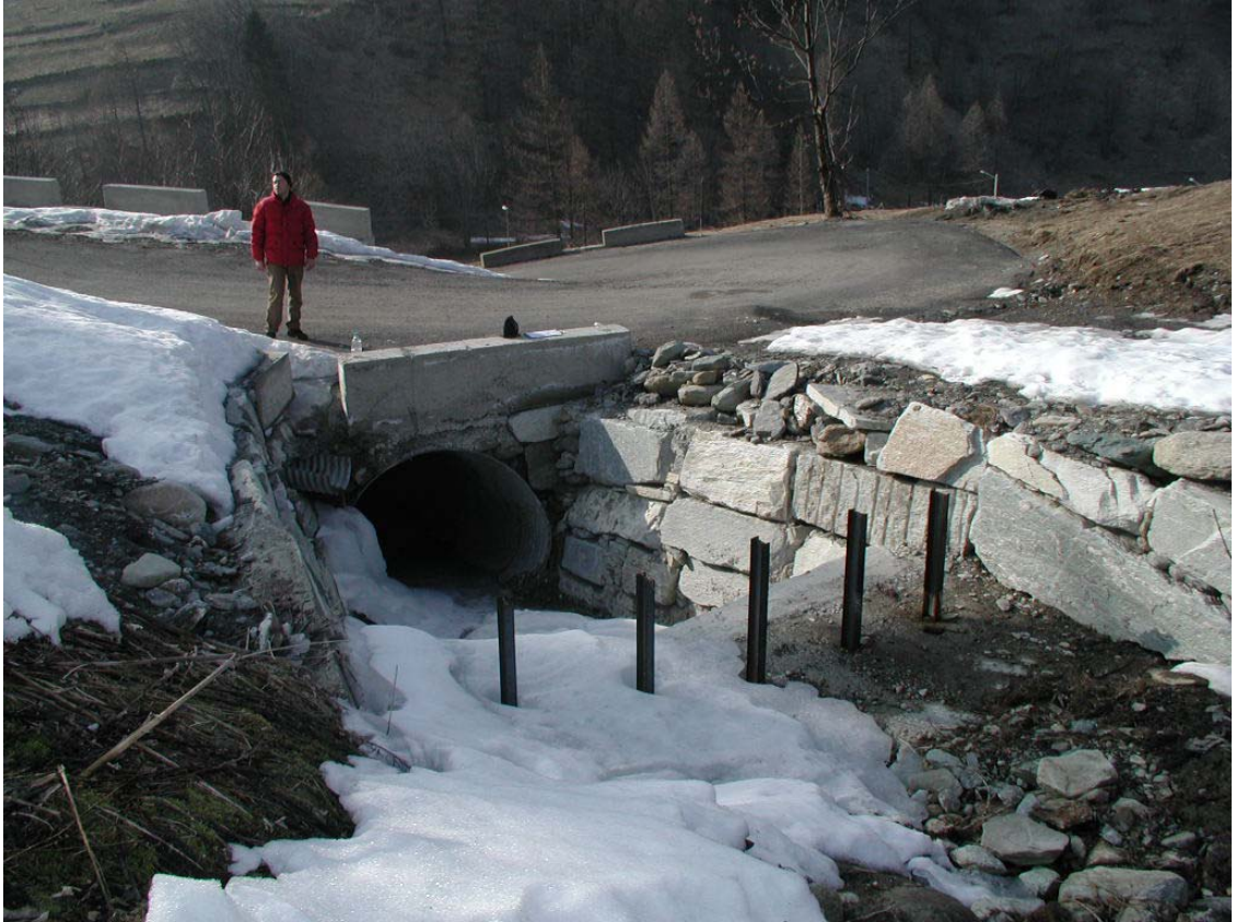
Foto 008 – Opera BATTBR013 . Ripresa da monte, sponda sinistra dell'affl. del T. Germanasca.