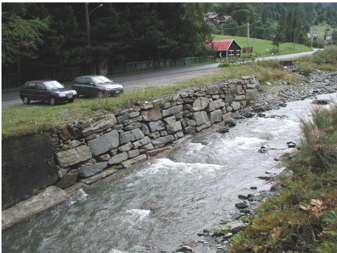
Foto 012 – Opera BATTDS012 . Da valle sponda destra del T. Germanasca.