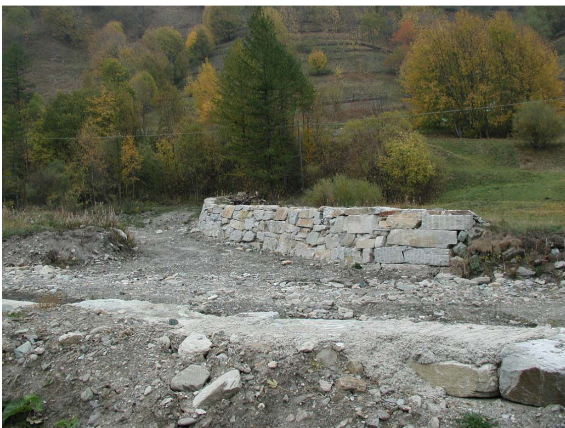
Foto 030 – Opera BELTDS031 . Ripresa di fronte, sponda destra del T. Germanasca.