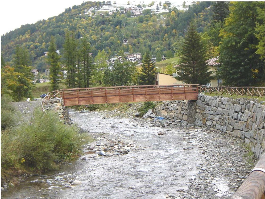
Foto 006 – Opera BATTPO006 . Da monte sponda destra del T. Germanasca.