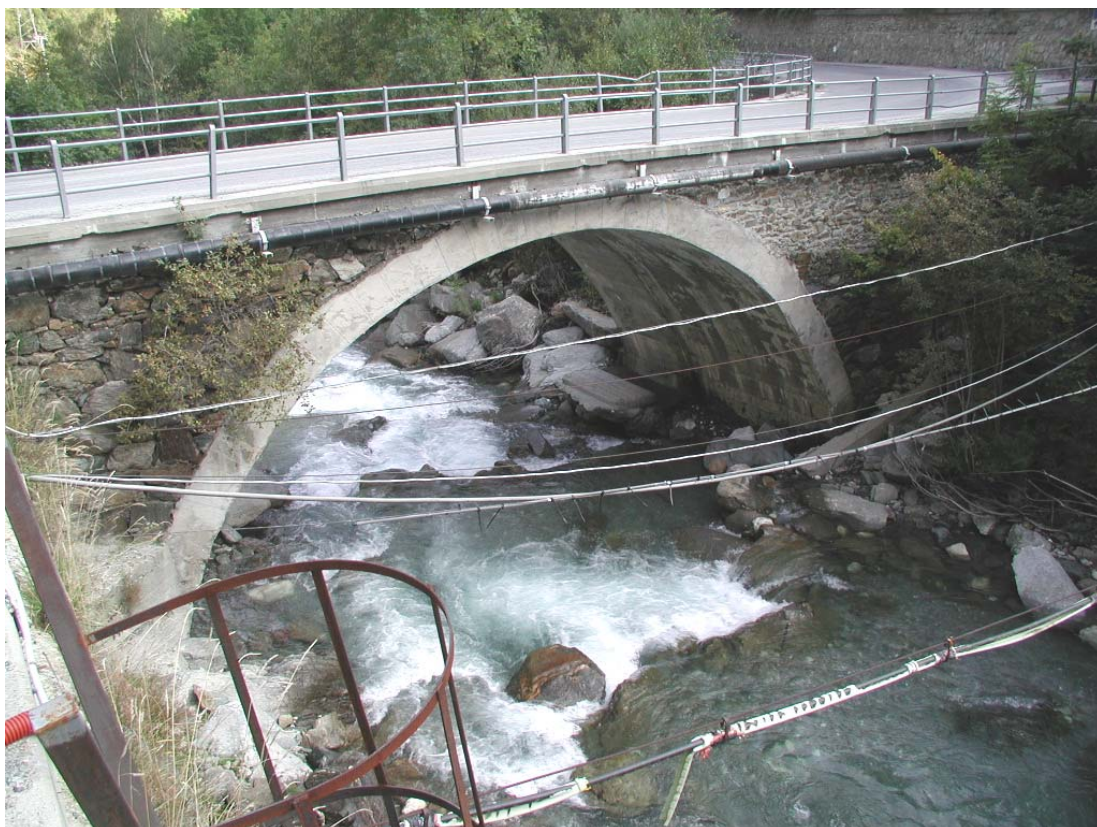
Foto 018 - Opera BATTPO018 . Da monte sponda sinistra del torrente.