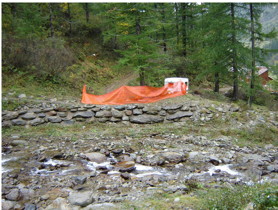
Foto 022 – Opera PENNDS022 . Ripresa di fronte, sponda destra del Rio d'Envie.