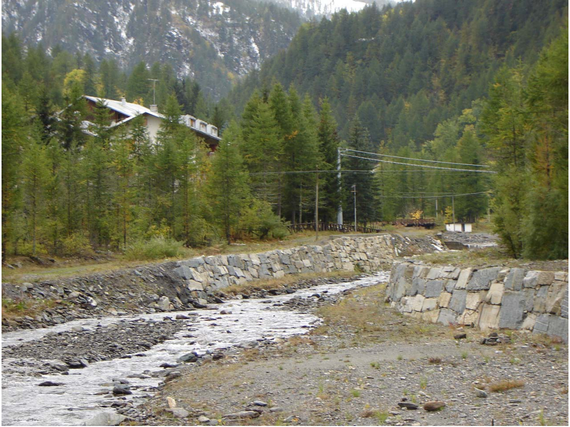
Foto 035 – Opera PENNDS037 . Ripresa da monte, sponda destra del T. Germanasca.