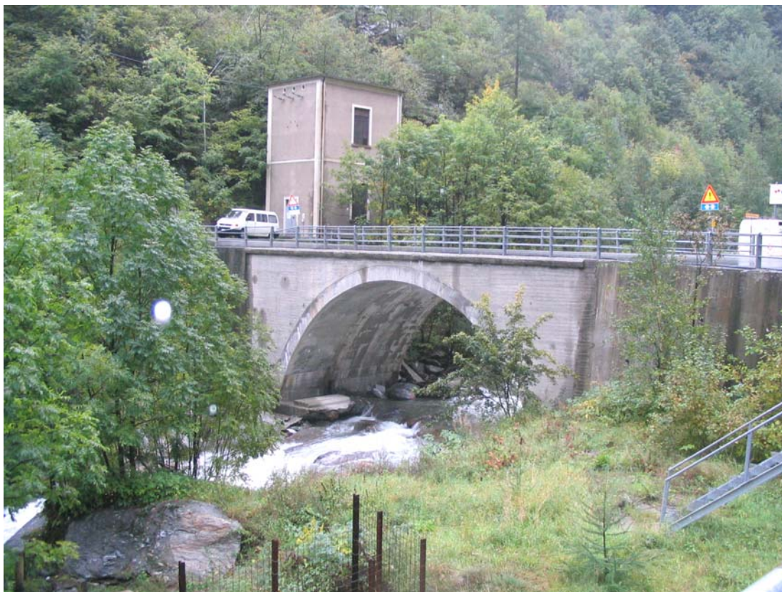
Foto 019 – Opera TREVPO019 . Ripresa da valle, sponda sinistra del T. Germanasca.