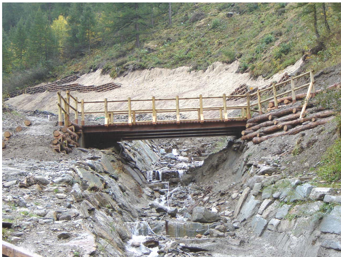
Foto 014 – Opera BATTAG021 . Ripresa da valle, sponda destra del rio affluente destro del T. Germanasca.