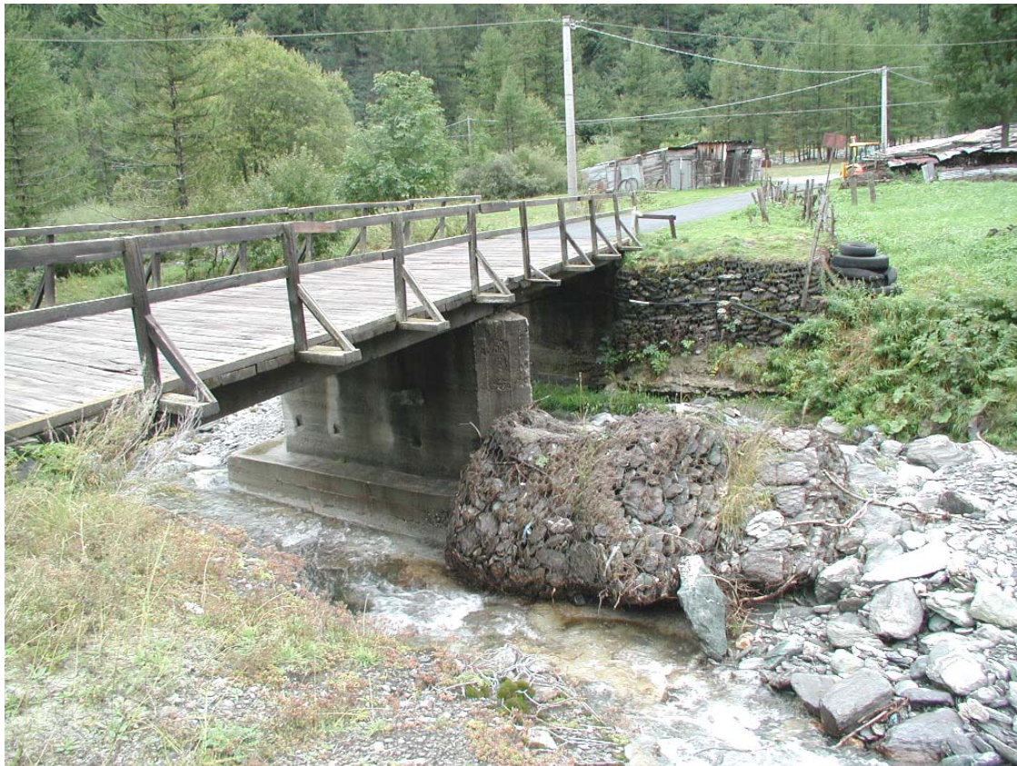
Foto 002 – Opera TREVPO002 . Da monte, sponda sinistra del T. Germanasca.