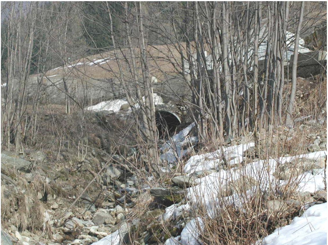
Foto 005 – Opera BATTAG011 . Ripresa da valle, in corrispondenza dell'alveo dell'affluente del T. Germanasca.