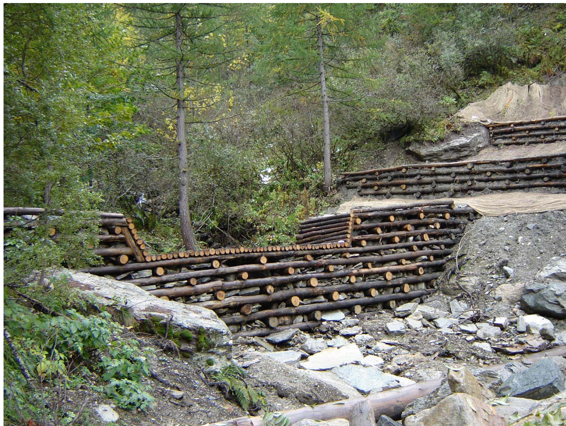
Foto 015 – Opera BATTBR022 . Ripresa da valle, sponda destra del Rio dell'Alpet.