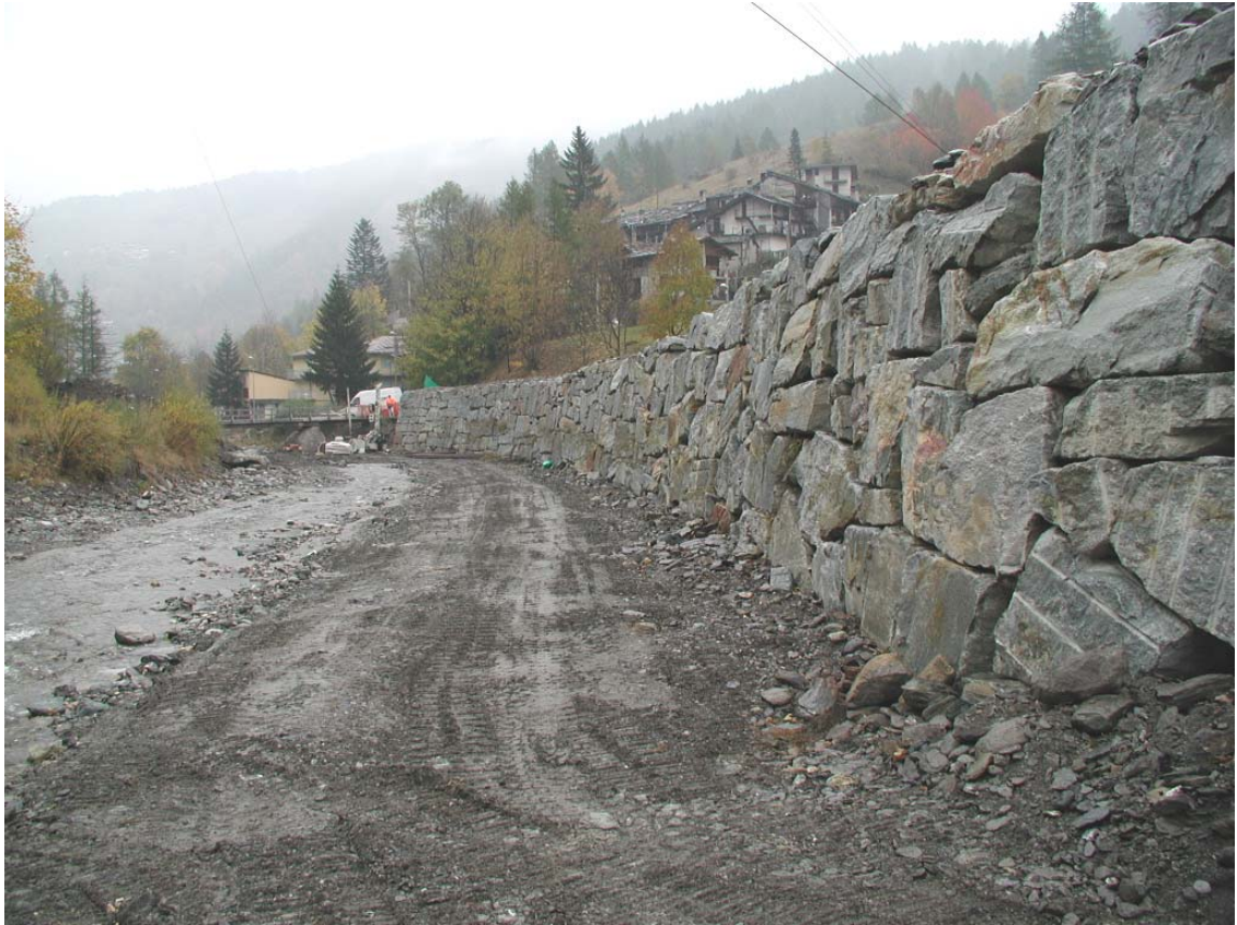
Foto 031 – Opera BATTDS032 . Ripresa da monte, in alveo del T. Germanasca.