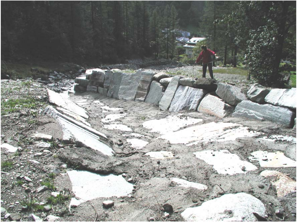
Foto 004. Opera BATTCA006 . Ripresa da monte dell'opera.