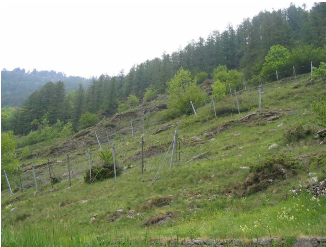
Foto 003 – Opera PENNPR002 . Ripresa da valle dalla ss 169 della Val Germanasca.