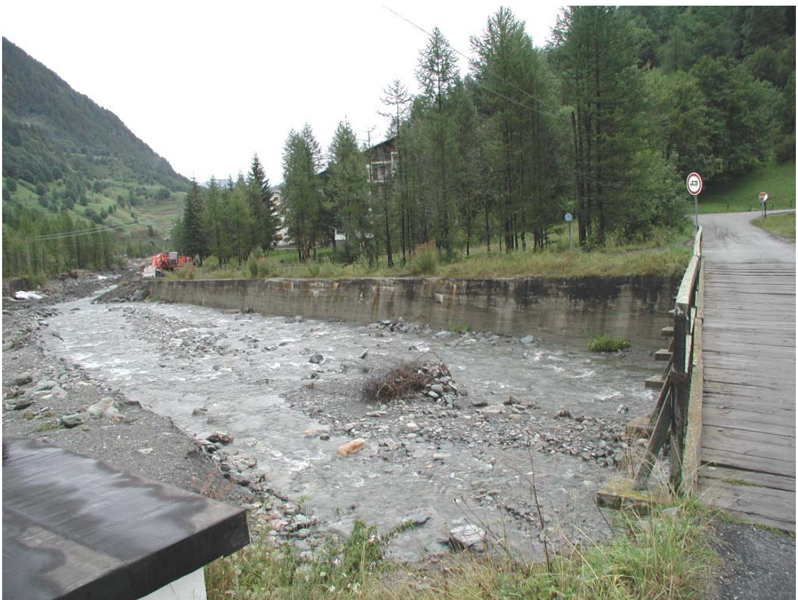
Foto 004 – Opera BATTDS004 . Da monte sponda destra del T. Germanasca.