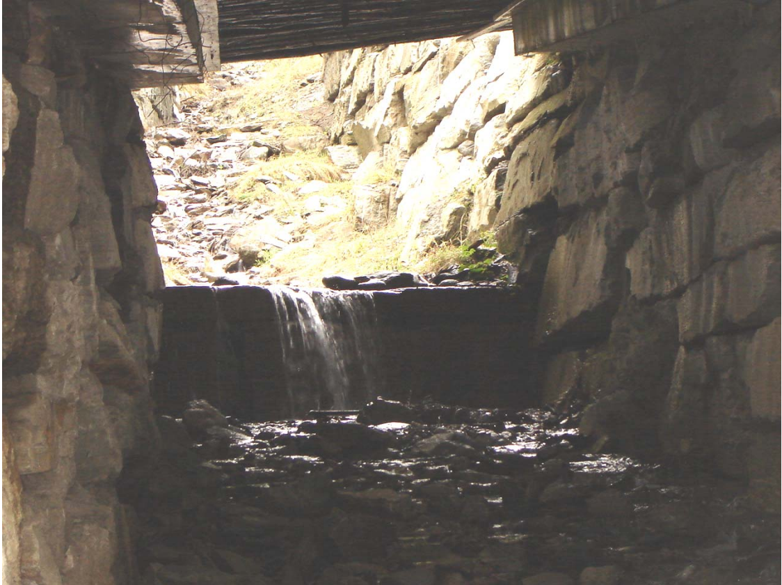
Foto 008 – Opera PENNSO008 . Ripresa da valle, dall'alveo del rio affluente destro del T. Germanasca.