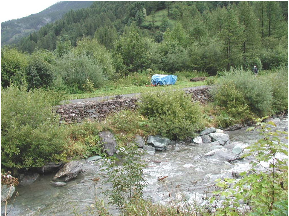
Foto 007 – Opera TREVDS007 . Da sponda destra del rio affluente del T. Germanasca, di fronte.