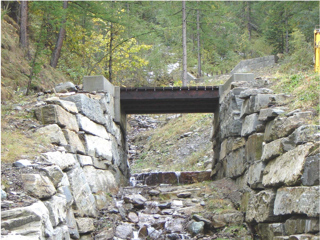
Foto 013 – Opera PENNAG020 . Ripresa da valle, dall'attraversamento BATTAG019.