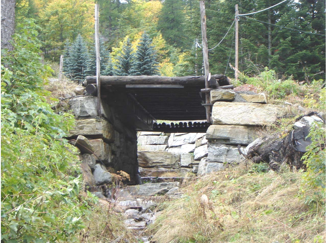
Foto 011 – Opera PENNAG018 . Ripresa da valle, sponda sinistra del rio affluente destro del T. Germanasca.