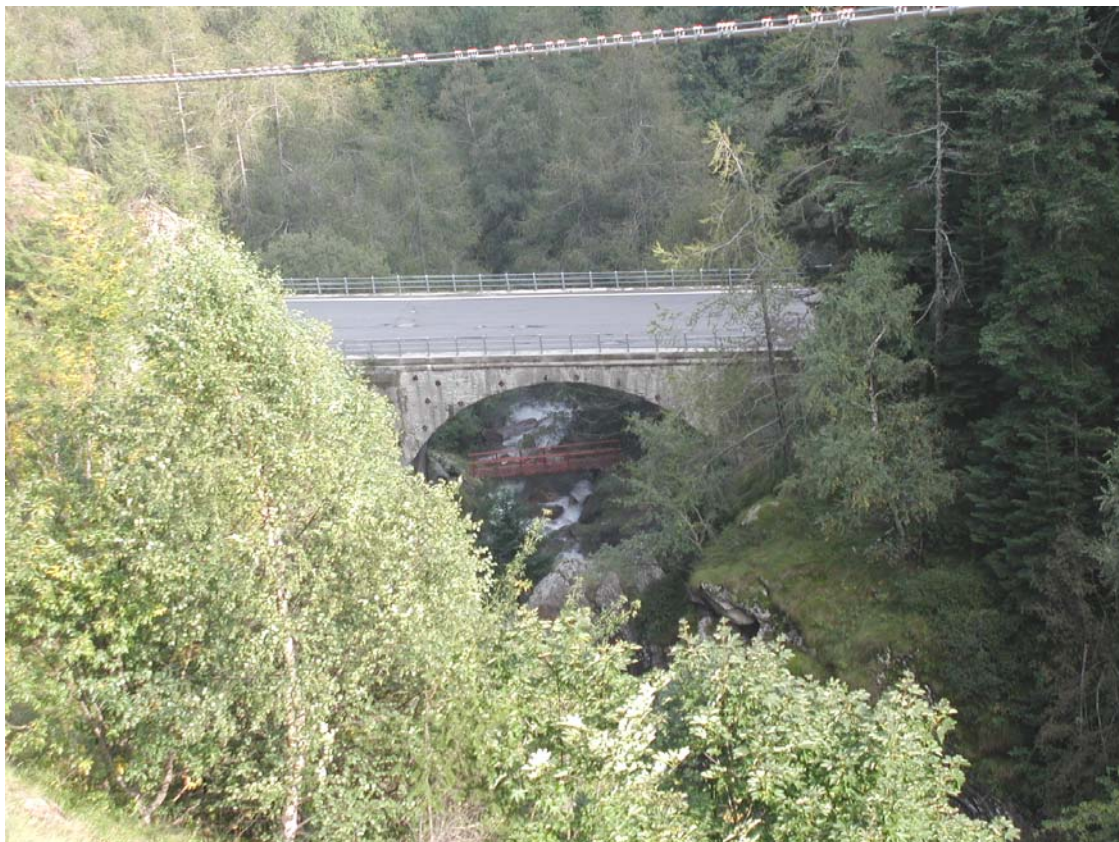
Foto 014 – Opera BATTPO014 . Da monte, di fronte, dalla strada che conduce a Rodoretto.