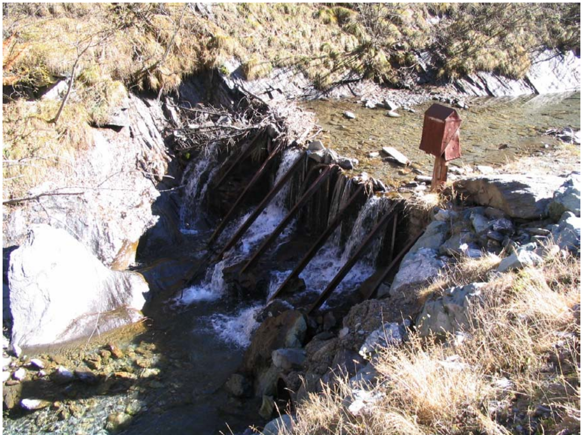
Foto 011 – Opera BATTSO011 . Ripresa da valle, sponda sinistra del T. Germanasca di Prali.