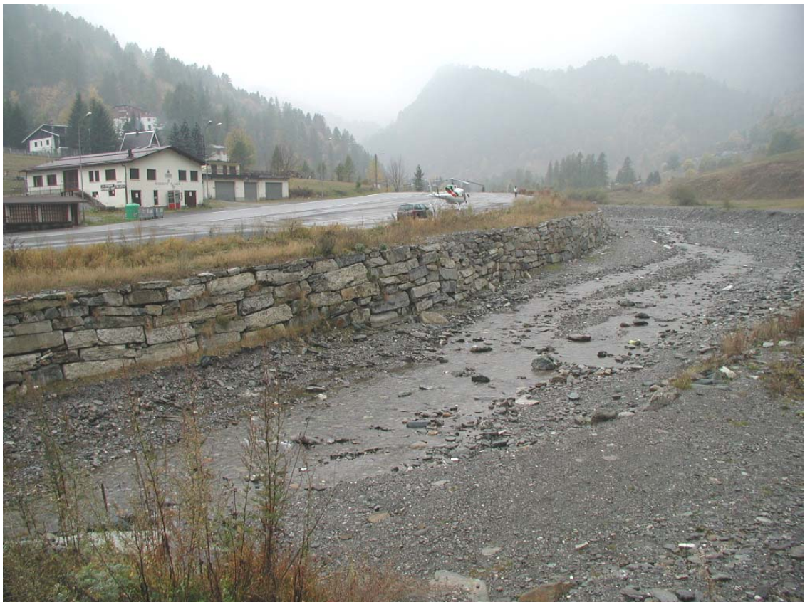
Foto 032 – Opera BELTDS033 . Ripresa da valle, sponda sinistra del T. Germanasca.