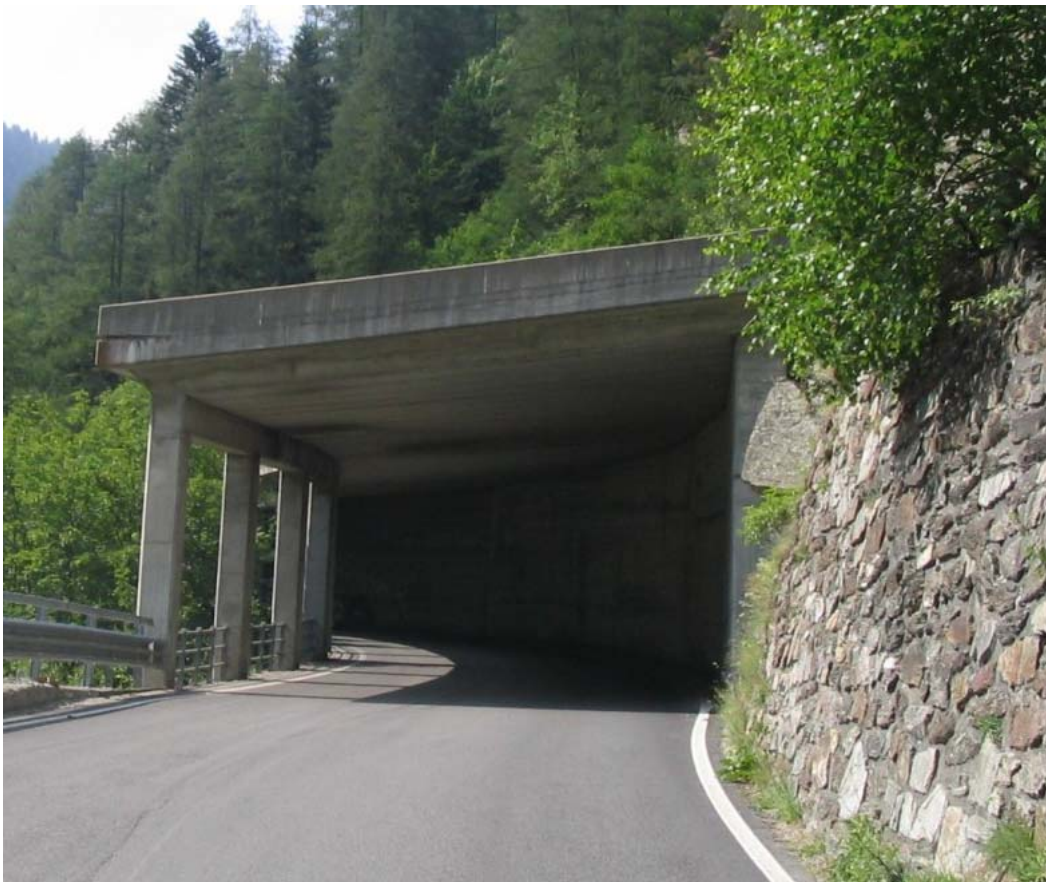
Foto 005 – Opera PENNPR004 . Ripresa da valle lungo la SS169 della Val Germanasca.