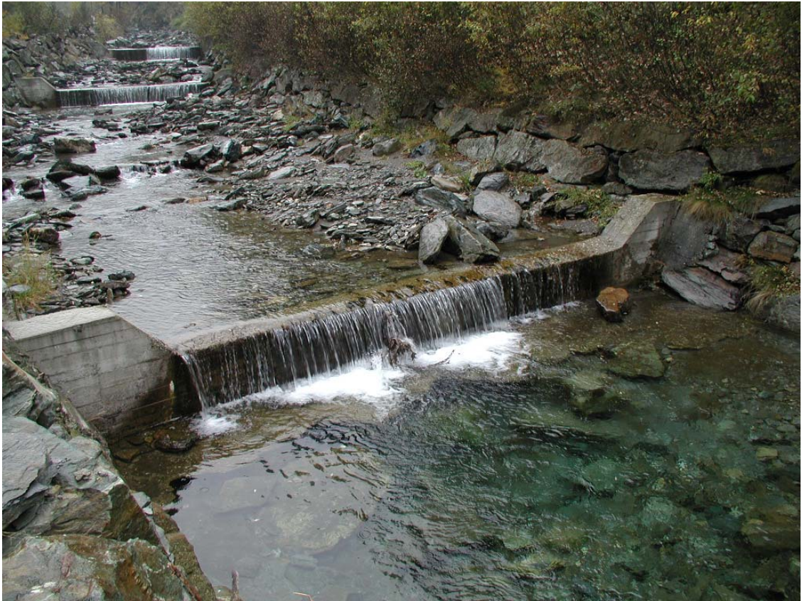
Foto 010 – Opera BELTBR016 . Ripresa da sponda destra del Rio delle Miniere.