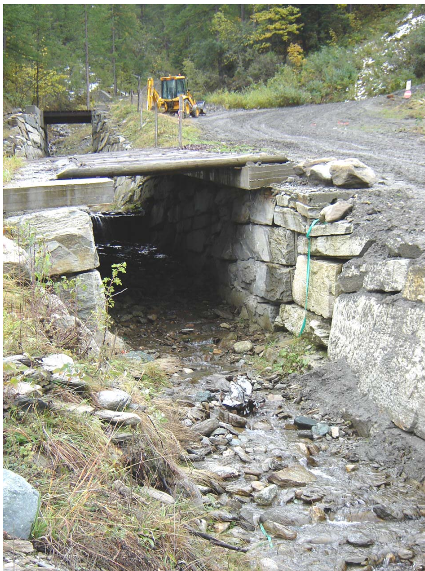
Foto 012 – Opera BATTAG019 . Ripresa da valle, sponda destra del rio affluente destro del T. Germanasca.