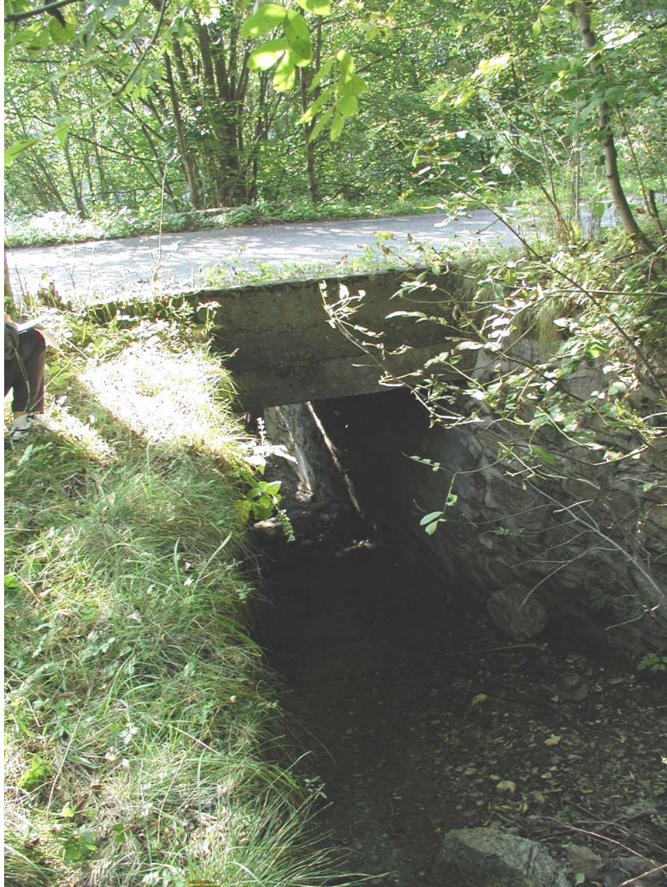
Foto 003 – Opera TREVAG009 . Da monte sponda sinistra del rio affluente del T. Germanasca.