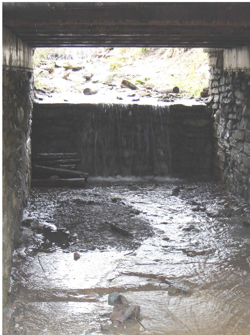
Foto 005 – Opera BATTSO005 . Ripresa da valle, dall'alveo del rio affluente destro del T. Germanasca.