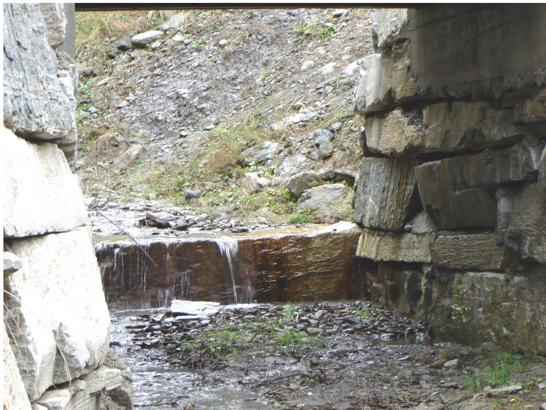
Foto 009 – Opera BATTSO009 . Ripresa da valle, sponda destra del rio affluente destro del T. Germanasca.