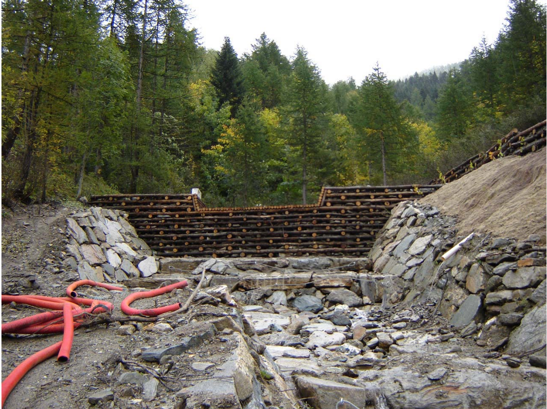
Foto 014 – Opera PENNBR021 . Ripresa da valle, sponda destra del Rio dell'Alpet.