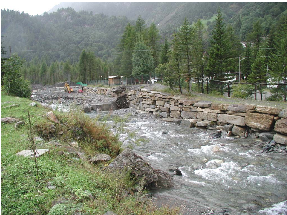
Foto 010 – Opera BATTDS010 . Da monte, sponda sinistra del T. Germanasca.