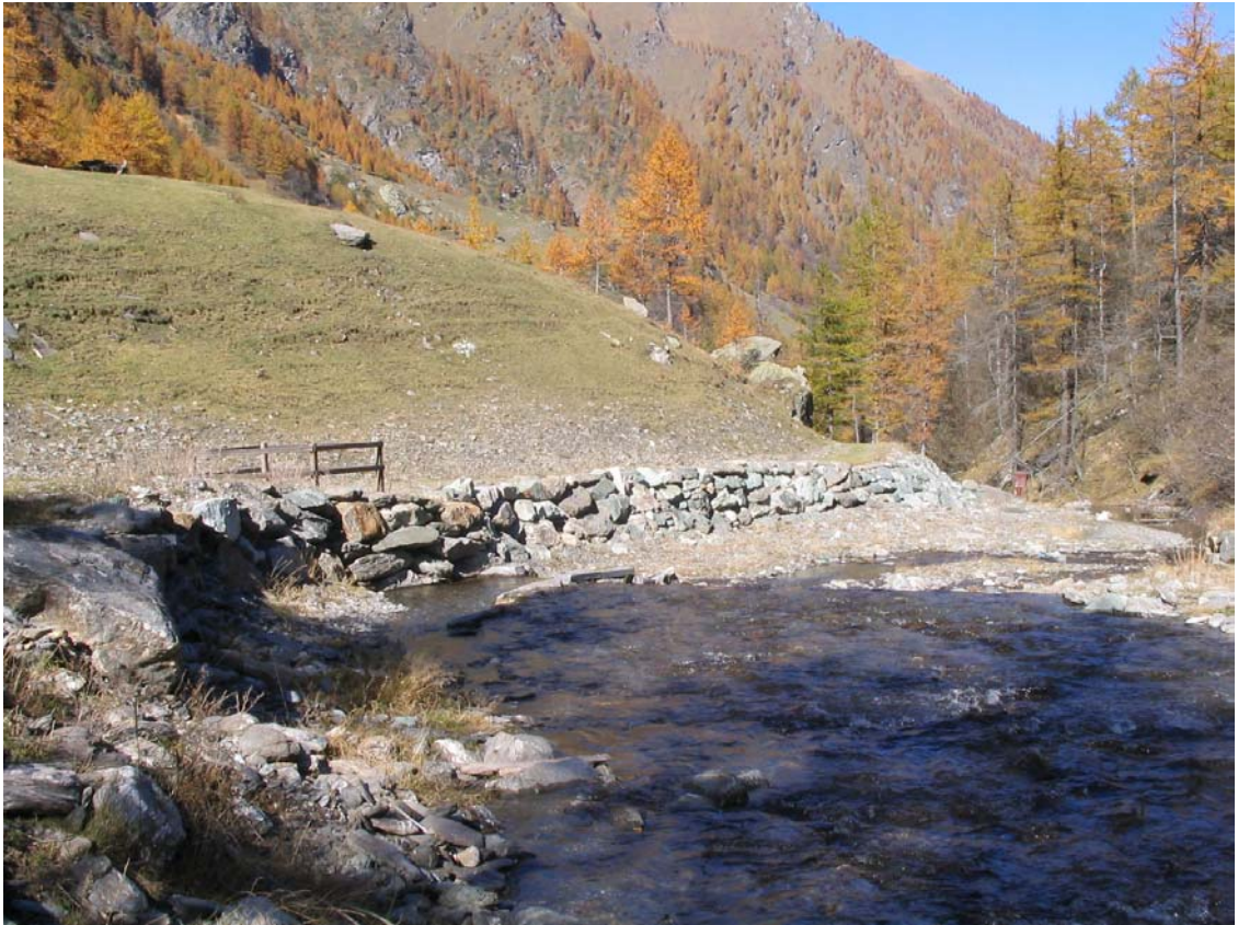
Foto 044 – Opera PENNDS045 . Ripresa da monte, sponda sinistra del T. Germanasca di Prali.