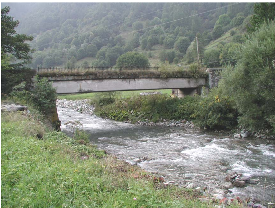
Foto 012 – Opera BATTPO012 . Da valle sponda destra del T. Germanasca.