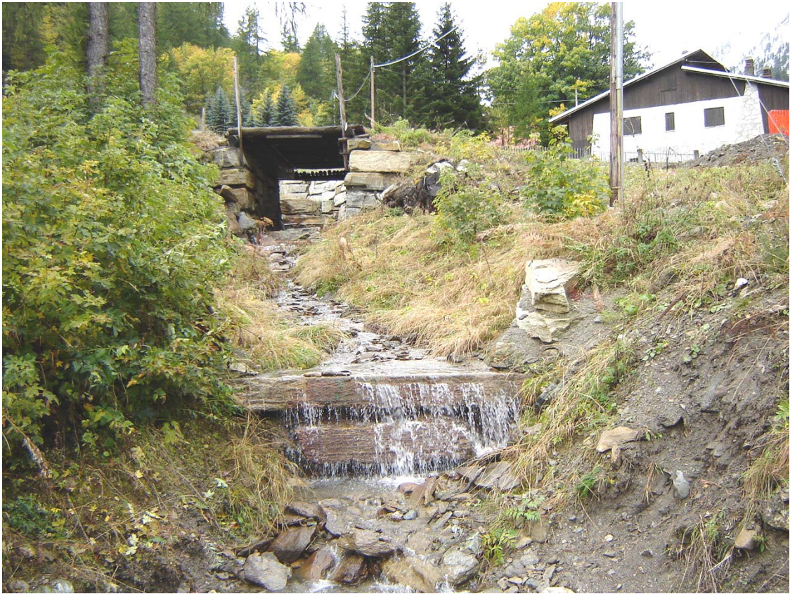
Foto 006 – Opera PENNSO006 . Ripresa da valle, sponda sinistra del rio affluente destro del T. Germanasca.