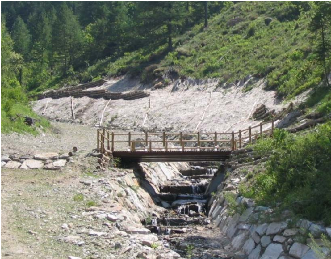
Foto 002 – Opera PENNDR001. Ripresa da valle, sponda destra del Rio Malzat.