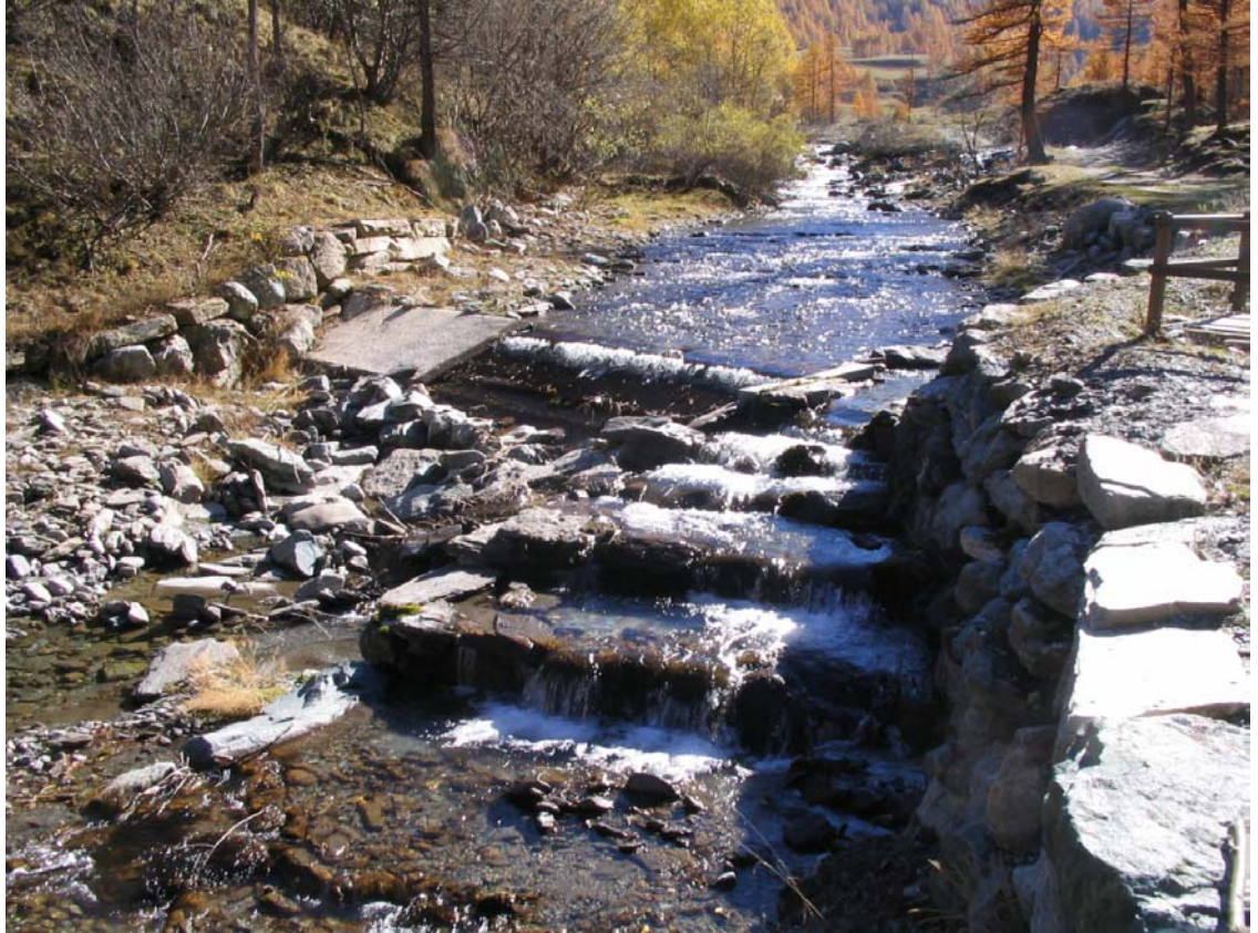
Foto 010 – Opera PENNSO010 . Ripresa da valle, sponda sinistra del T. Germanasca di Prali.