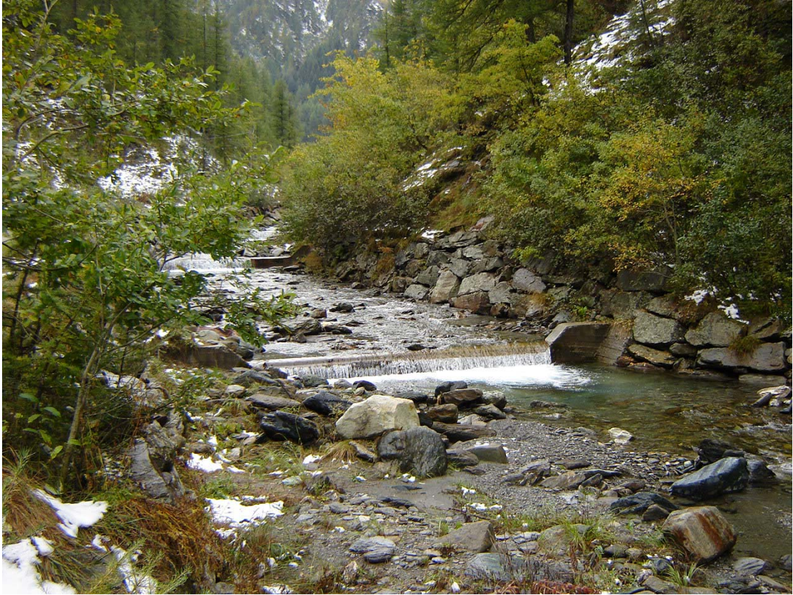
Foto 012 – Opera PENNBR019 . Ripresa da valle, sponda destra del Rio delle Miniere.