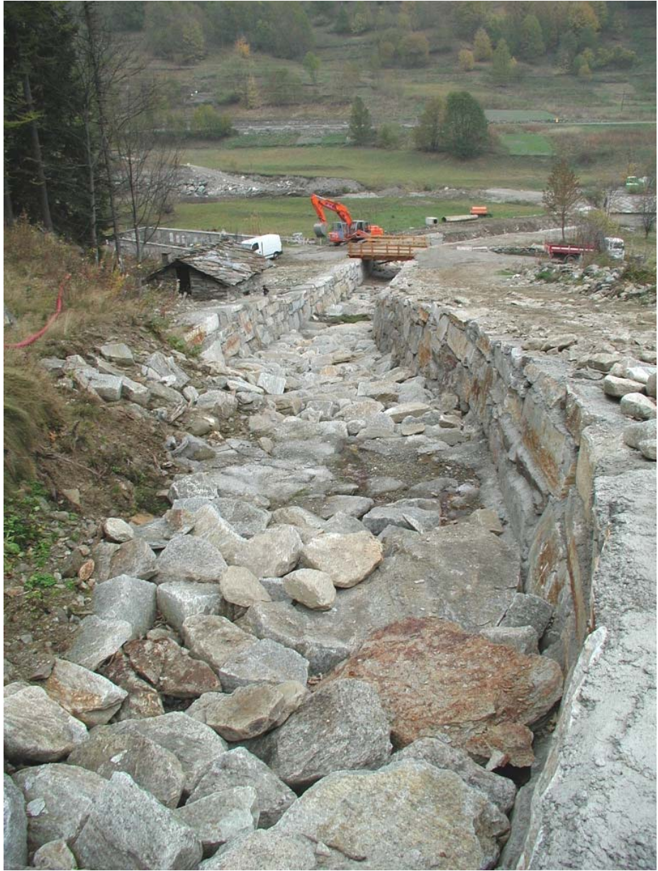
Foto 003. Opera BELTCA005 . Ripresa da monte dell'affl. del T. Germanasca.