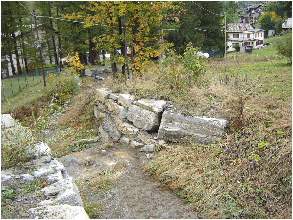
Foto 040 – Opera PENNDS041 . Ripresa da monte, sponda sinistra del rio affluente destro del T. Germanasca.