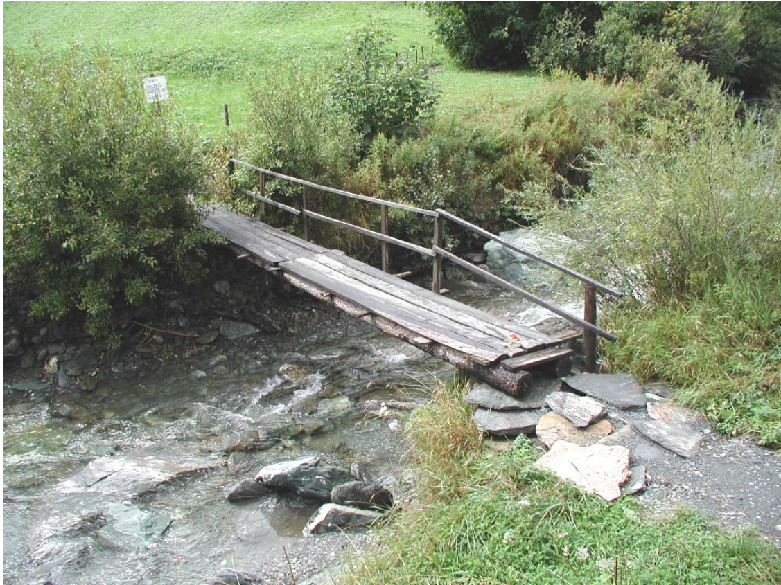
Foto 003 – Opera BATTPO003 . Da valle, sponda sinistra del T. Germanasca.