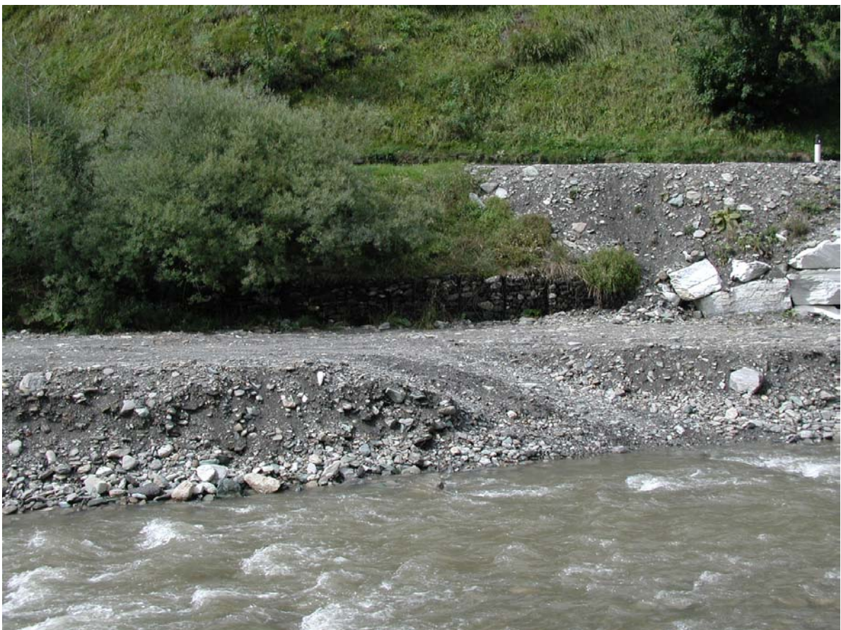
Foto 018 – Opera BATTDS018 . Da sponda destra del T. Germanasca, di fronte.