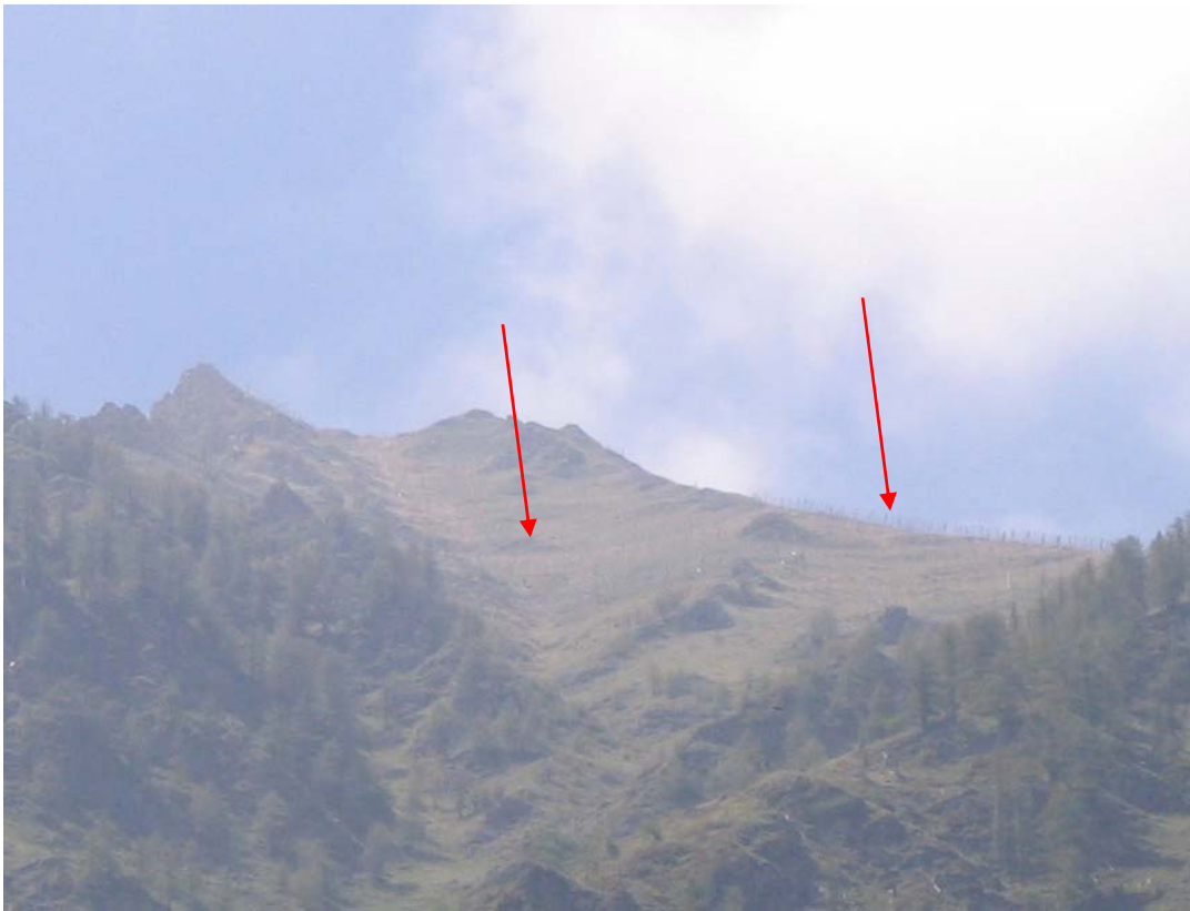
Foto 001 – Opera PENNPR001 . Ripresa da fondovalle dall'abitato di Malzat.