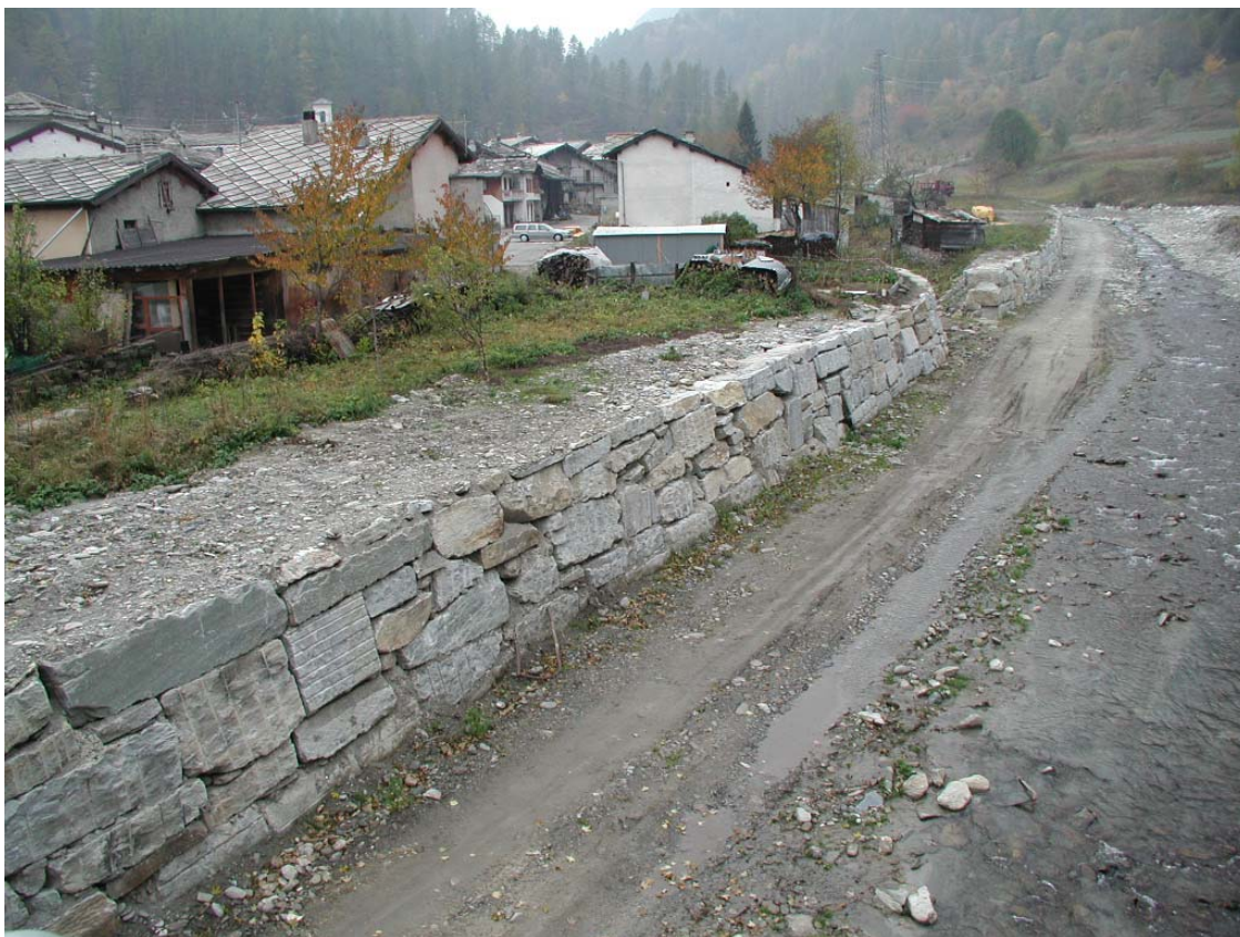
Foto 029 – Opera BATTDS030 . Ripresa da valle, dal ponte BATTPO012.