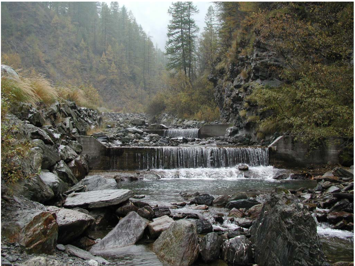
Foto 009 – Opere BELTBR014 e BATTBR015 . Ripresa da valle, in alveo del Rio delle Miniere.