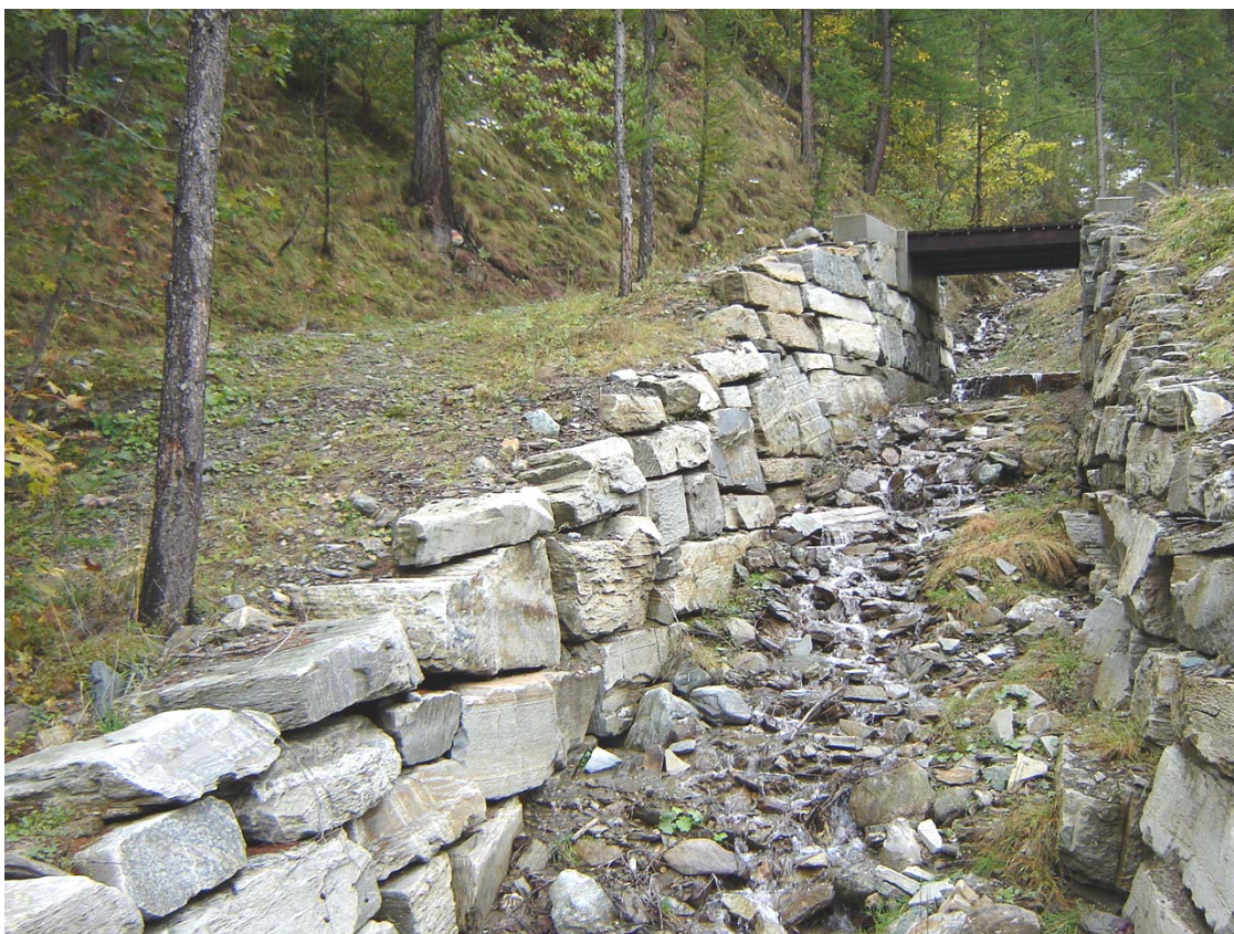
Foto 021 – Opera BATTDS021 . Ripresa da valle, sponda destra del rio affluente destro del T. Germanasca.