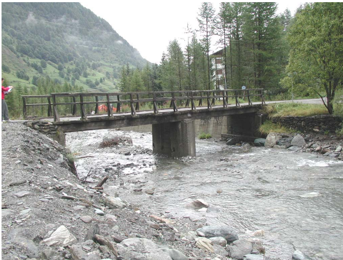
Foto 001 – Opera BATTPO001 . Da monte, sponda destra del Rio dei Tredici Laghi.