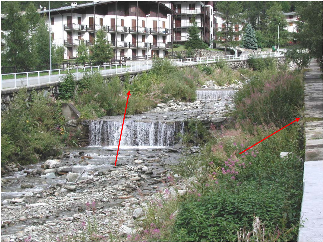
Foto 023 – Opere BATTDS023 e TREVDS024 . Ripresa da valle, sponda sinistra del Rio d'Envie.