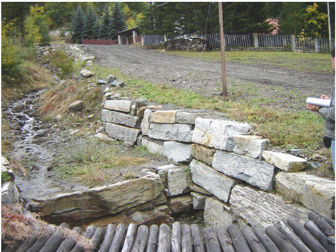
Foto 041 – Opera BATTDS042 . Ripresa da valle, dall'attraversamento PENNAG018.