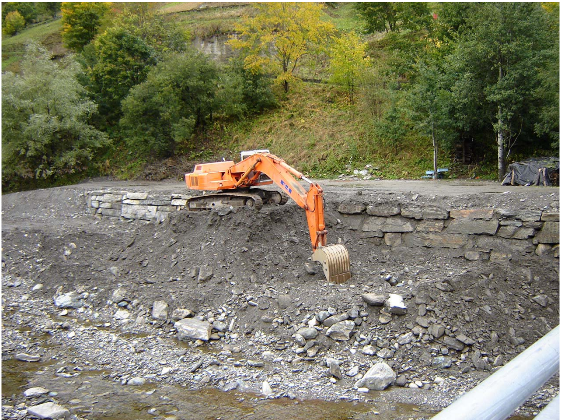
Foto 036 – Opera BATTDS038 . Ripresa da monte, dal ponte TREVPO035.