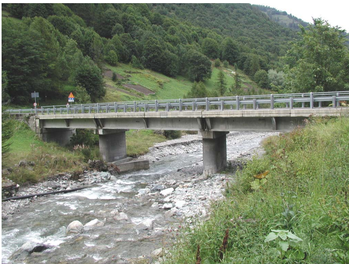
Foto 008 – Opera BATTPO008 . Da monte sponda destra del T. Germanasca.