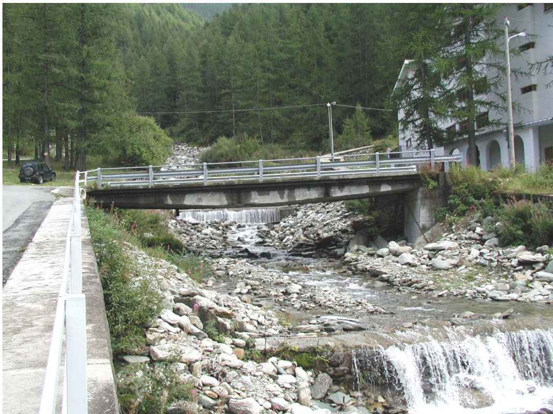
Foto 010 – Opera BATTPO010 . Da valle, sponda destra del Rio d'Envie.