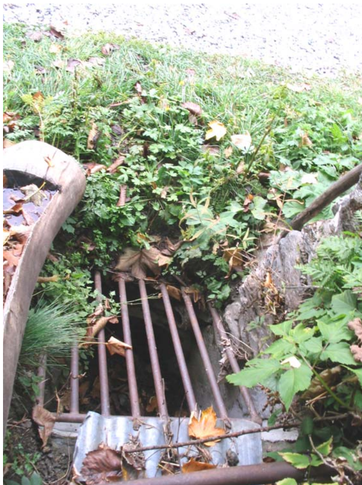
Foto 015 – Opera PENNAG022 . Primo piano sull'imbocco a monte dalla tubazione.