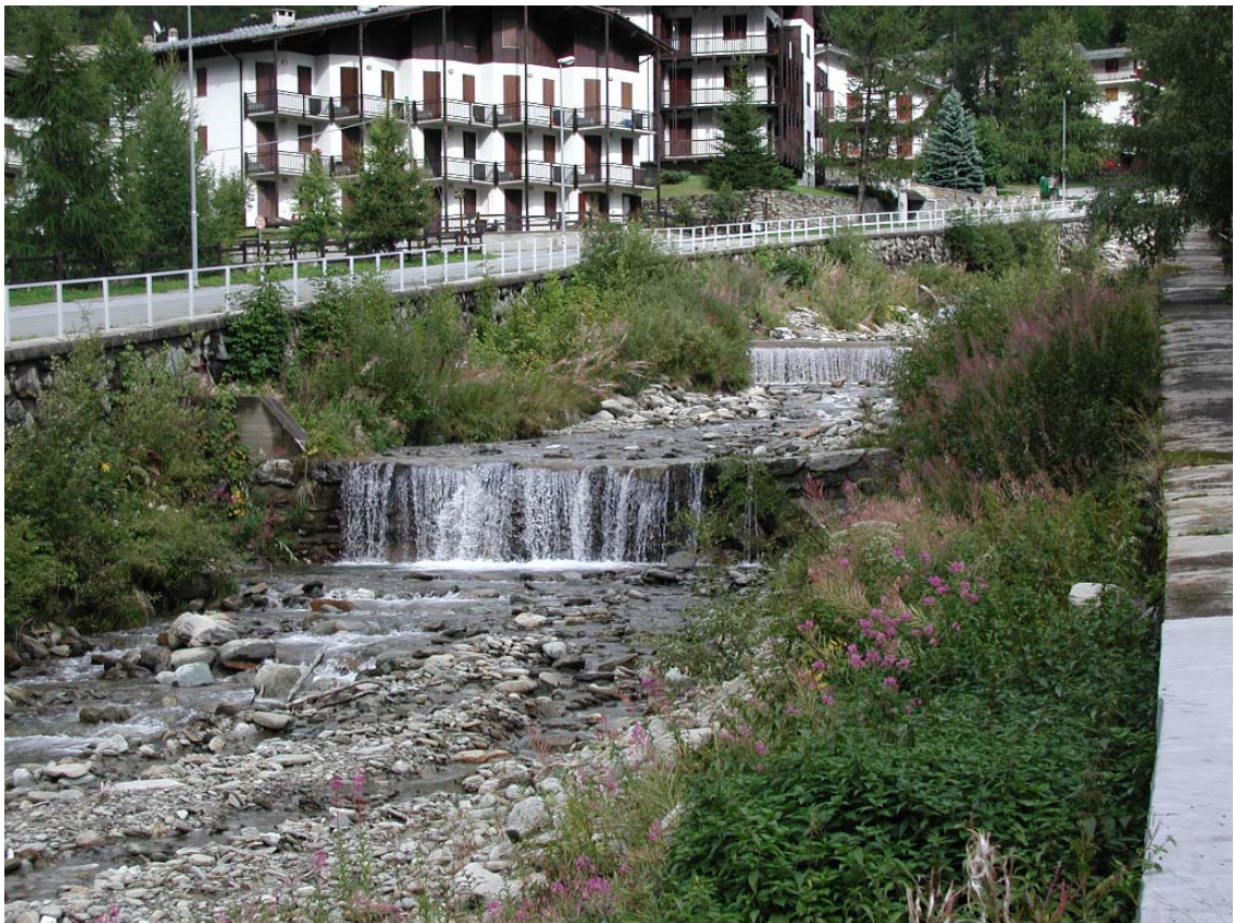
Foto 002 – Opera TREVR002 e TREVR006 . Ripresa da valle sponda sinistra del Rio d'Envie.