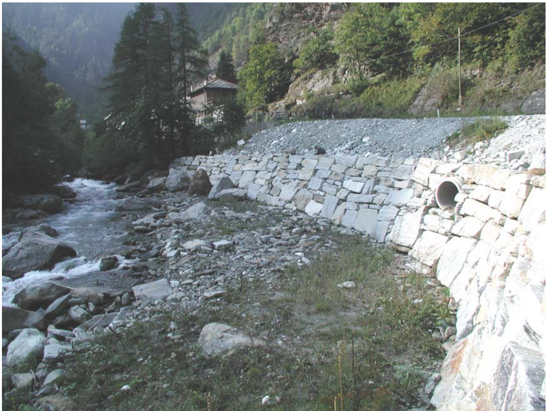
Foto 020 – Opera BATTDS020 . Da valle, sponda sinistra del T. Germanasca, in corrispondenza dell'opera.