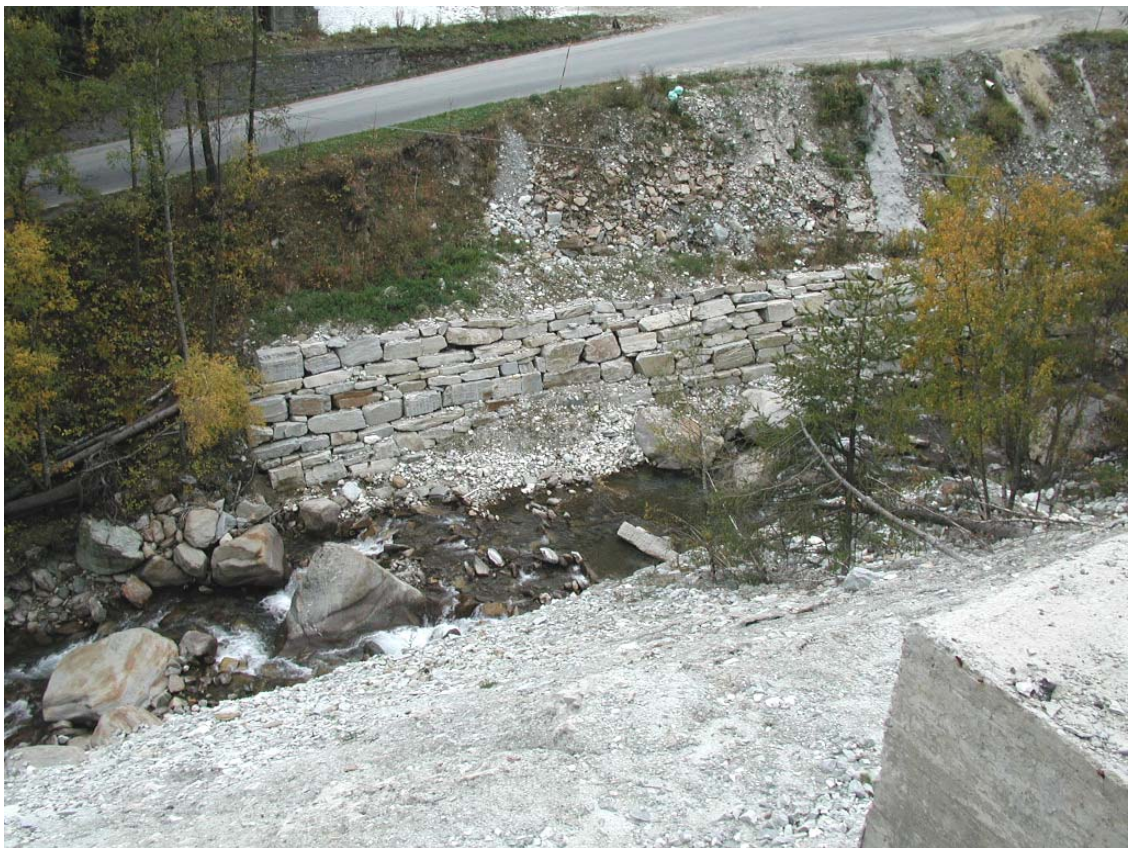
Foto 024 – Opera BELTDS025 . Ripresa di fronte, sponda destra del T. Germanasca.