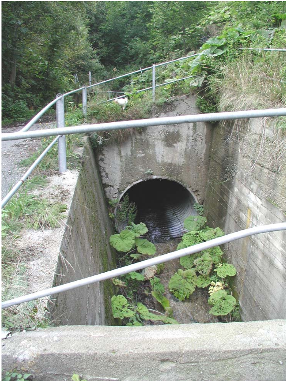
Foto 001 - Opera BATTCA003 . Foto scattata in corrispondenza dell'opera.