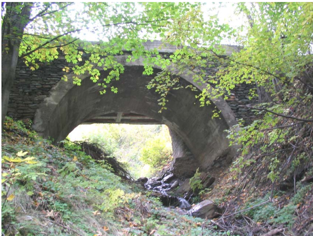
Foto 017 – Opera TREVPO017 . Da valle sponda destra del rio affluente sinistro del T. Germanasca.