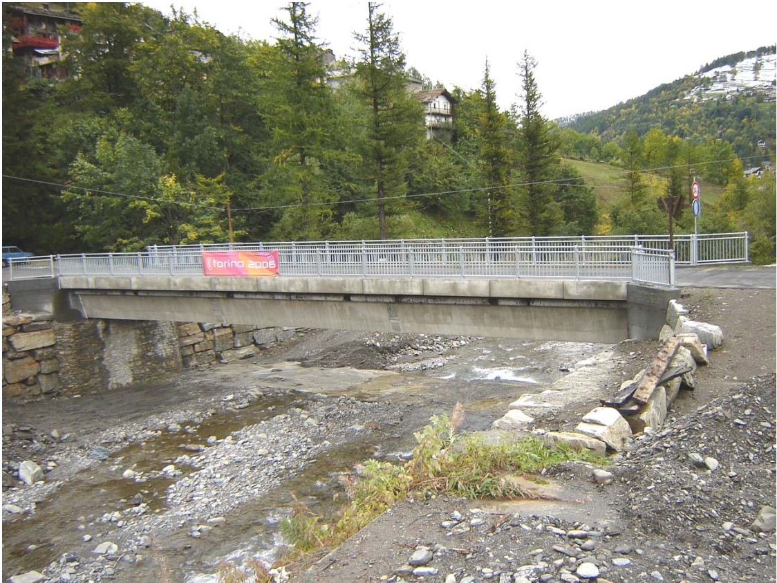
Foto 005 – Opera TREVPO005 . Da monte sponda destra del T. Germanasca.