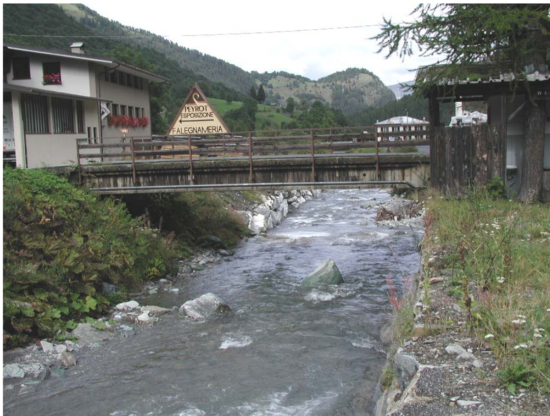
Foto 007 – Opera TREVPO007 . Da monte sponda destra del T. Germanasca.