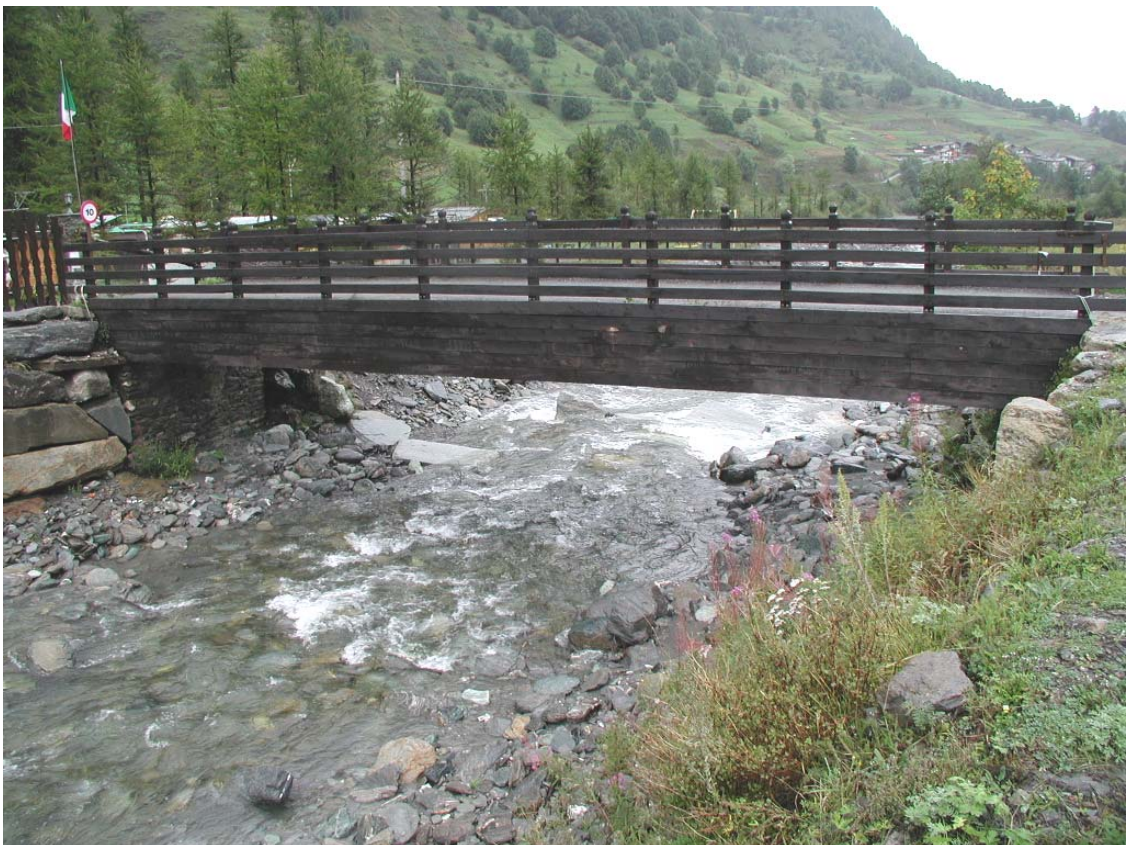
Foto 003 – Opera TREVPO004 . Da monte sponda destra del T. Germanasca.