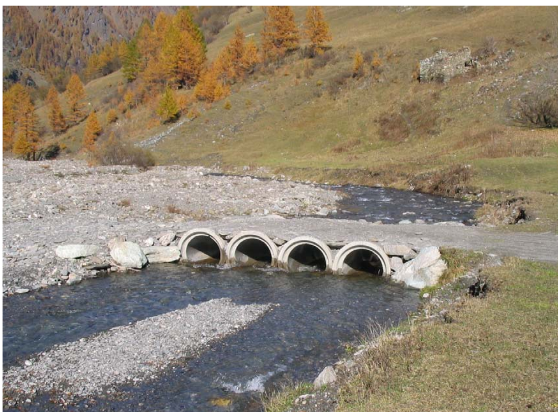
Foto 016 – Opera PENNAG023 . Ripresa da monte, sponda destra del T.Germanasca di Prali