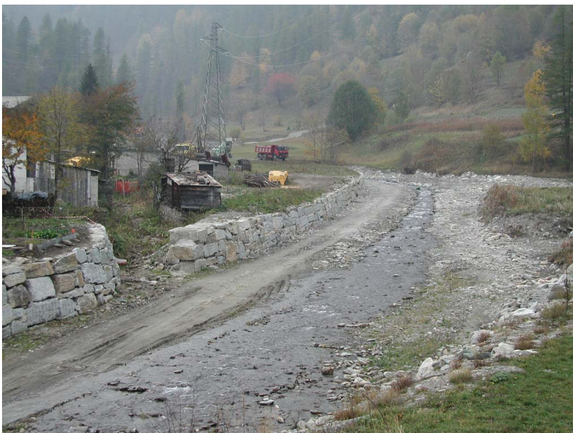
Foto 028 – Opera BELTDS029 . Ripresa da valle, dal ponte BATTPO012.