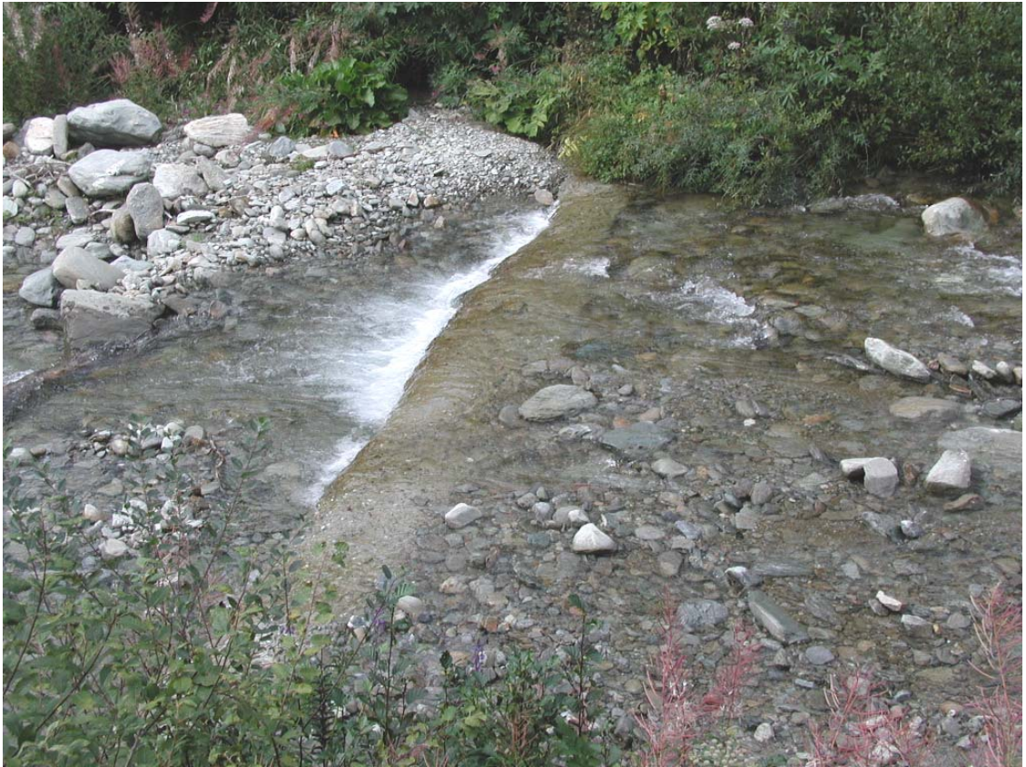
Foto 001 – Opera TREVS0001 . Da monte sponda sinistra del Rio d'Envie.