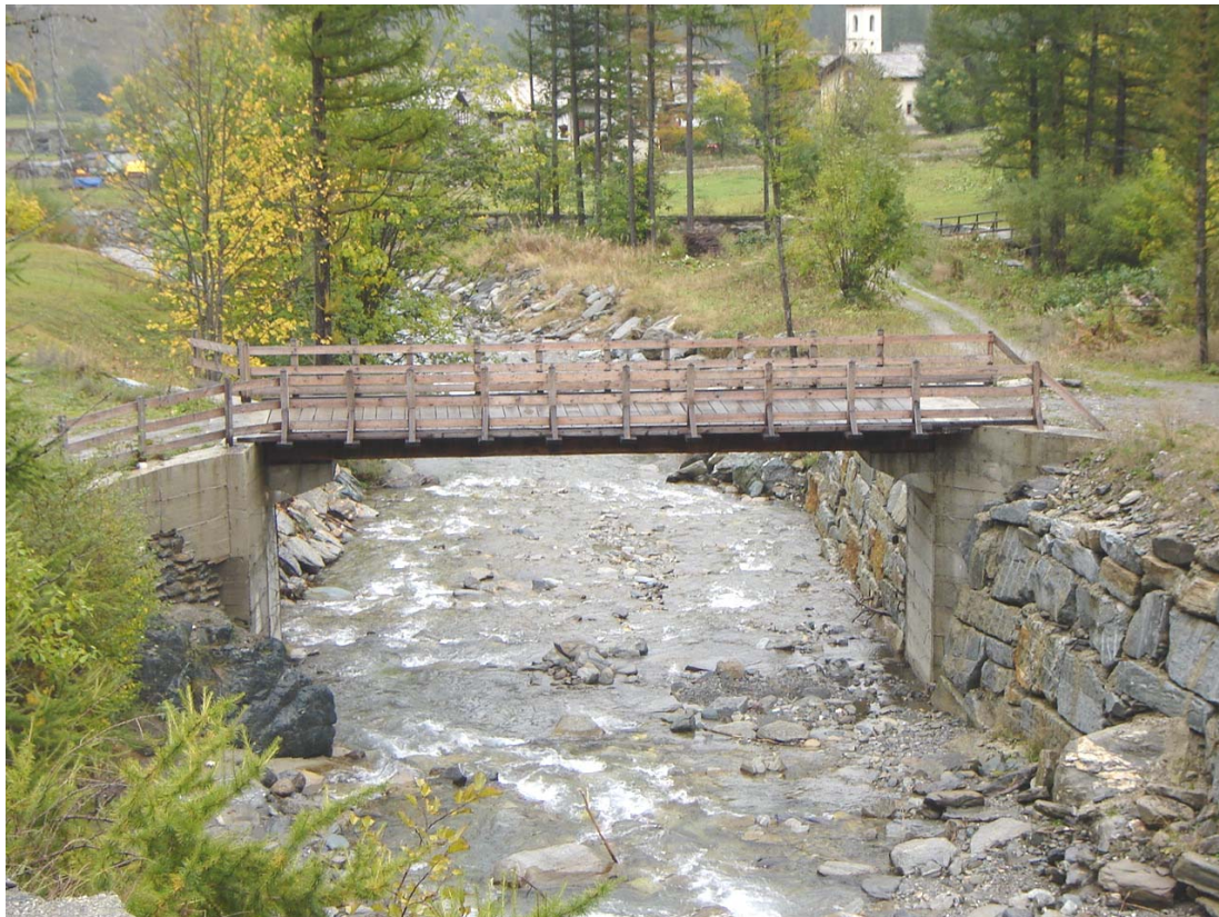
Foto 020 – Opera PENNPO020 . Ripresa da monte, sponda sinistra del T. Germanasca.