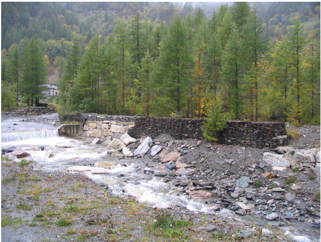
Foto 005 – Opera TREVDS005 . Da valle sponda destra del T. Germanasca.