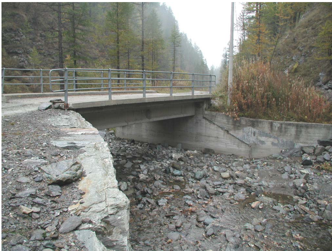
Foto 011 – Opera BATTPO011 . Da valle sponda destra del Rio delle Miniere.