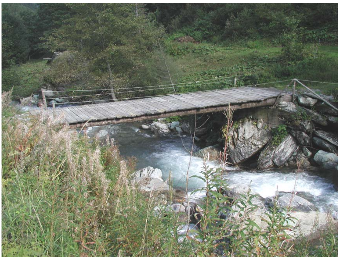
Foto 016 – Opera BATTPO016 . Da monte sponda sinistra del T. Germanasca.