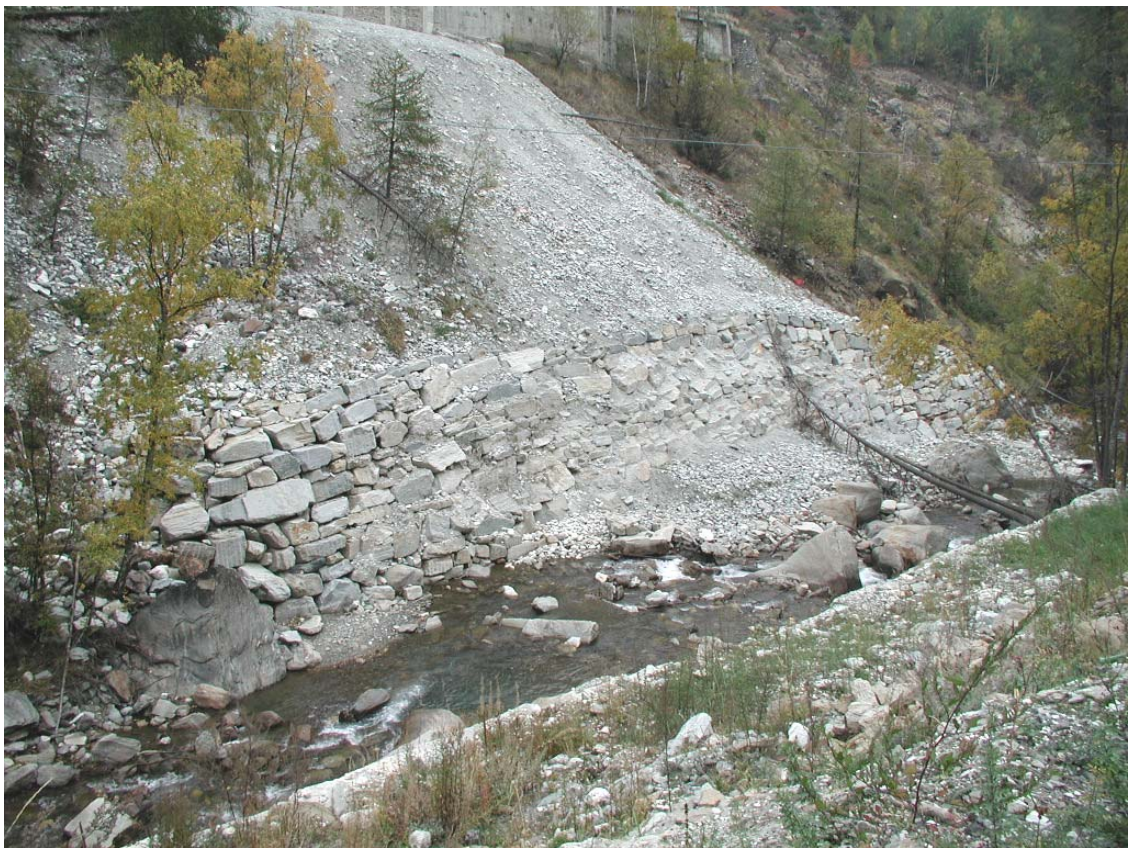
Foto 025 – Opera BATTDS026 . Ripresa frontale, sponda destra del T. Germanasca.