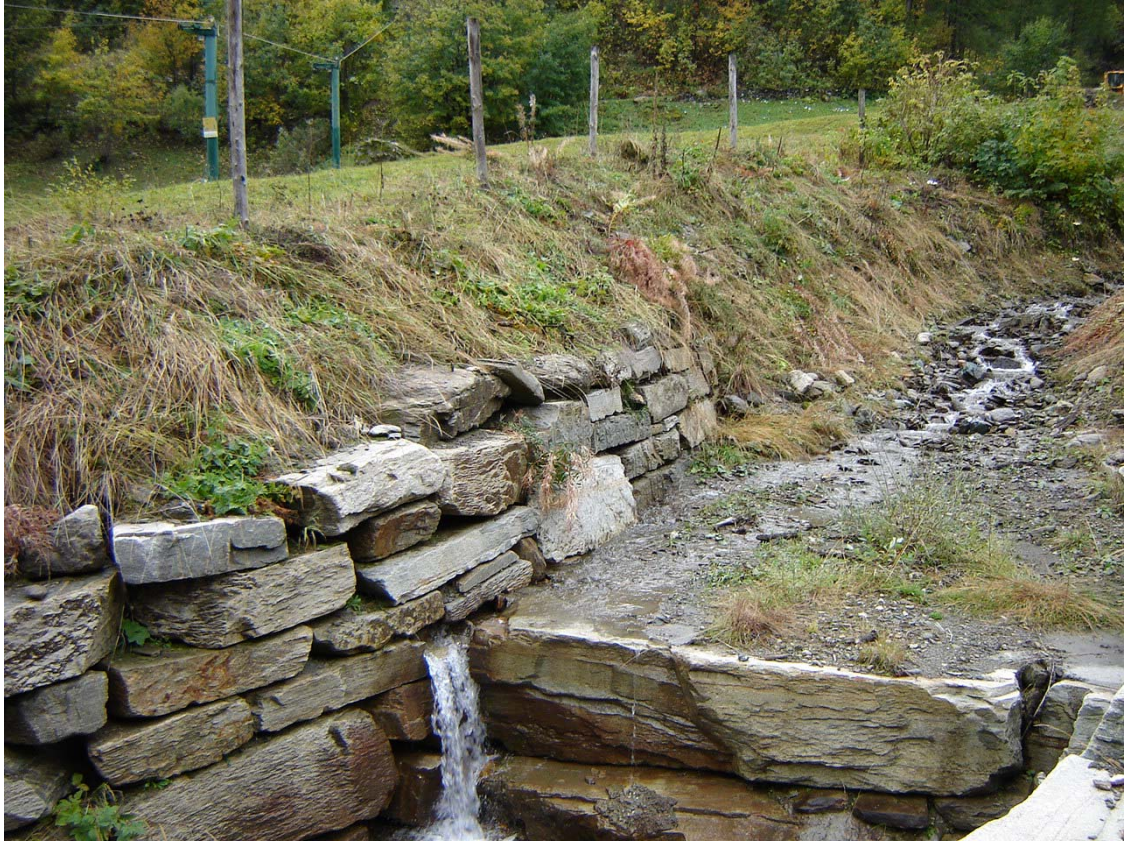
Foto 042 – Opera PENNDS043 . Ripresa da valle, sponda destra del rio affluente destro del T. Germanasca.