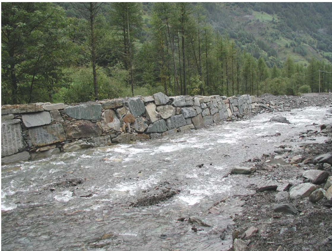
Foto 001 – Opera TREVDS001 . Da sponda destra del T. Germanasca, di fronte.