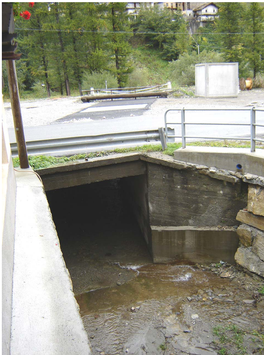
Foto 006 – Opera BATTCA008 . Ripresa da monte, sponda sinistra del rio affluente destro del T. Germanasca.