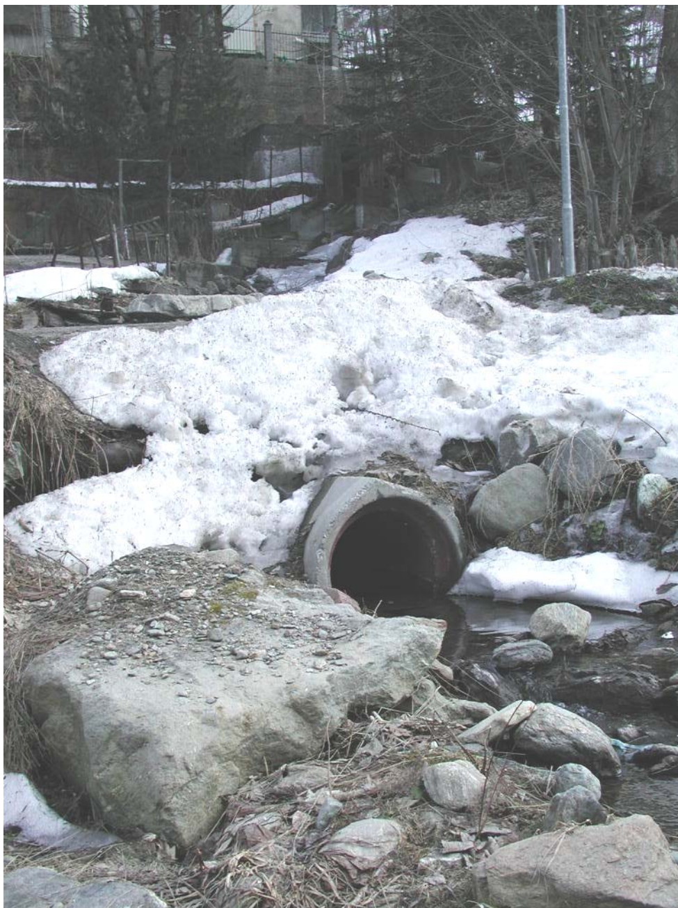
Foto 007 – Opera BATTAG013 . Ripresa da valle dell'opera in corrispondenza della confluenza con il T. Germanasca.