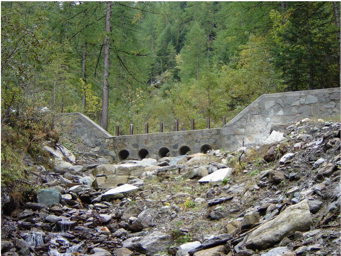
Foto 013 – Opera BATTBR020 . Ripresa da valle, dall'alveo del rio affluente destro del T. Germanasca.