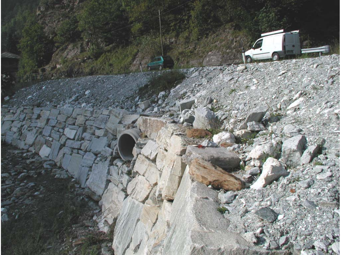
Foto 004 – Opera BATTAG010 . Da valle, sponda sinistra dell'affluente, in corrispondenza della confluenza con il T. Germanasca.