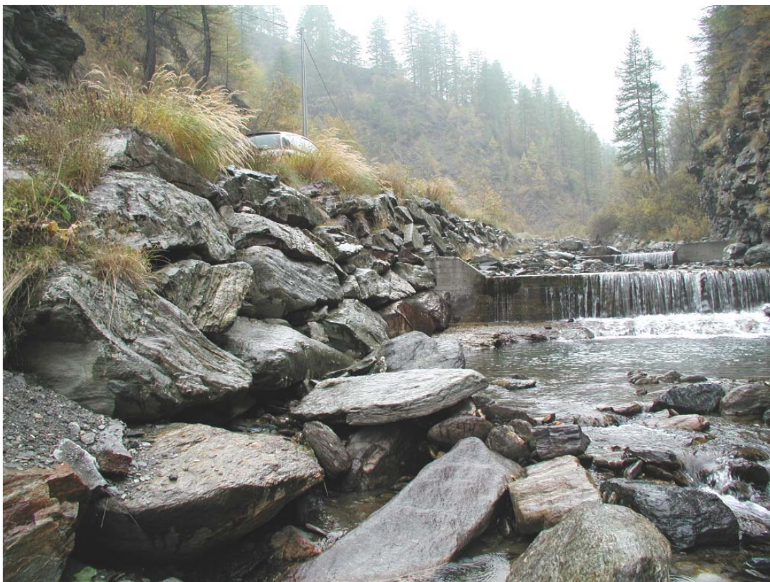
Foto 033 – Opera BATTDS035 . Ripresa da valle, in alveo del Rio delle Miniere.