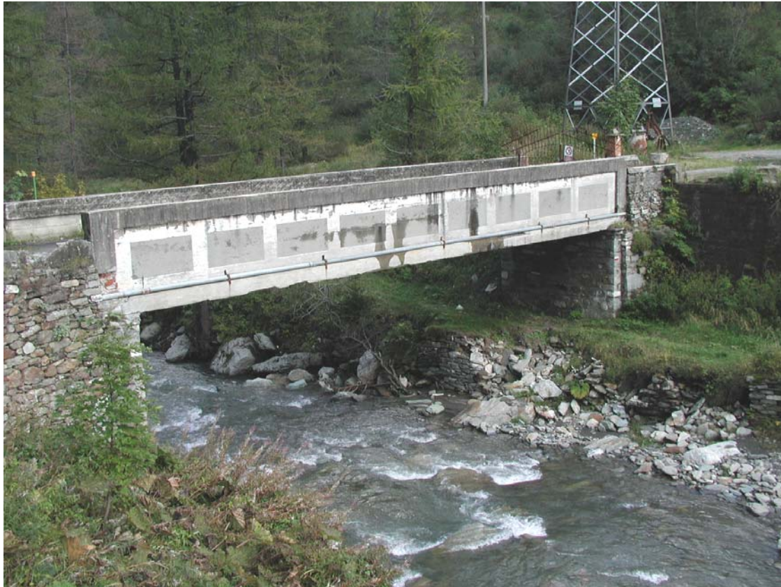
Foto 013 – Opera TREVPO013 . Da monte sponda sinistra del T. Germanasca.