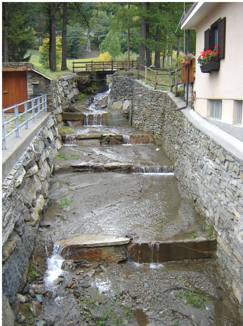
Foto 005 – Opera PENNCA007. Ripresa da valle del rio affluente destro del T. Germanasca.