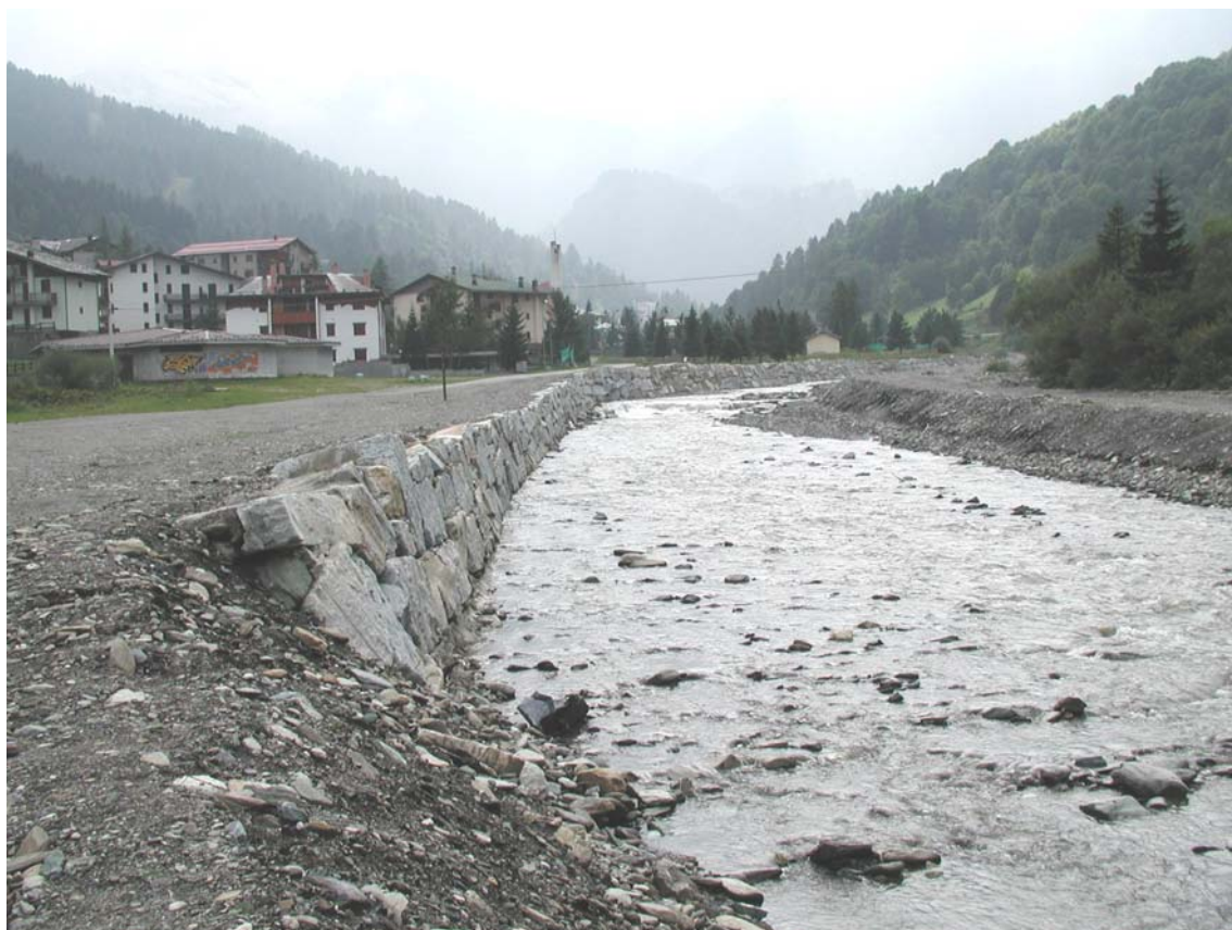
Foto 016 – Opera BATTDS016 . Da valle, sponda destra del T. Germanasca, in corrispondenza dell'opera.