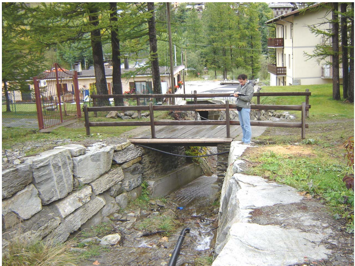
Foto 009 – Opera PENNAG016 . Ripresa da monte, sponda destra del Rio del rio affluente destro del T. Germanasca.