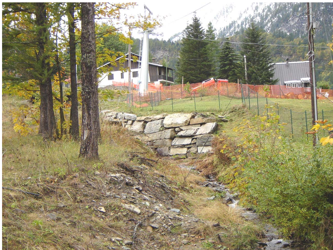
Foto 038 – Opera BATTDS040 . Ripresa da valle, sponda destra del rio affluente destro del T. Germanasca.