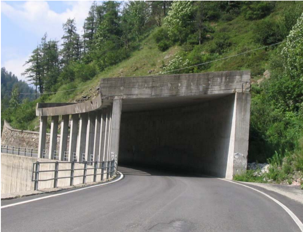
Foto 004 – Opera PENNPR003 . Ripresa da valle lungo la SS169 della Val Germanasca.