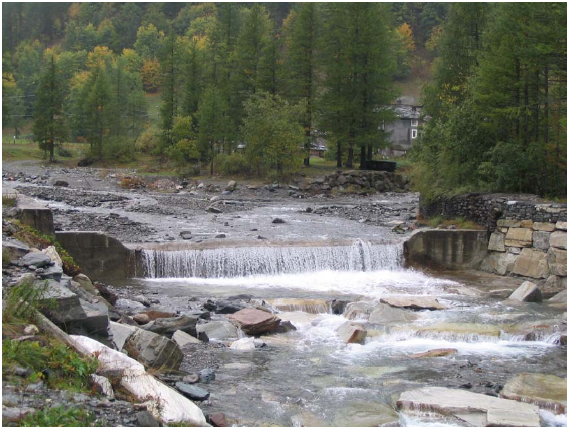
Foto 001 – Opera BATTBR001 . Ripresa da valle sponda destra del T. Germanasca.