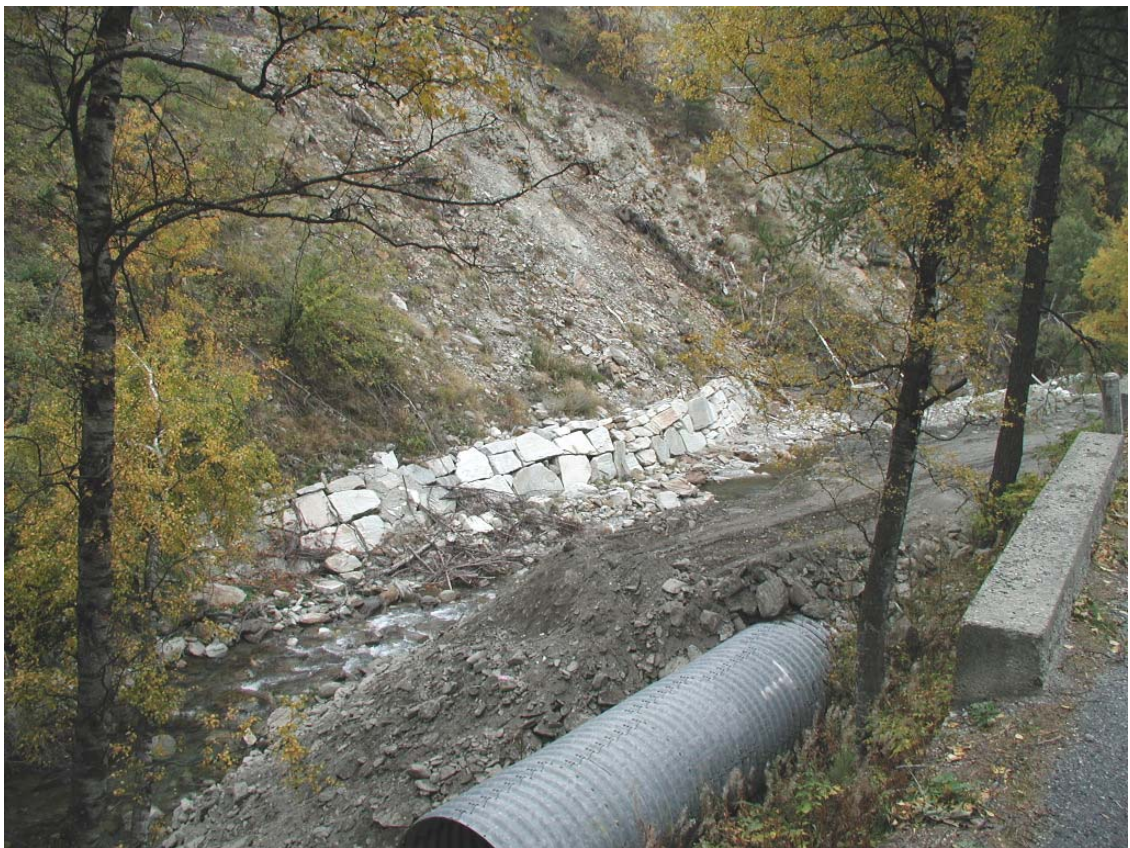
Foto 026 – Opera BELTDS027 . Ripresa da monte, sponda destra del T. Germanasca.