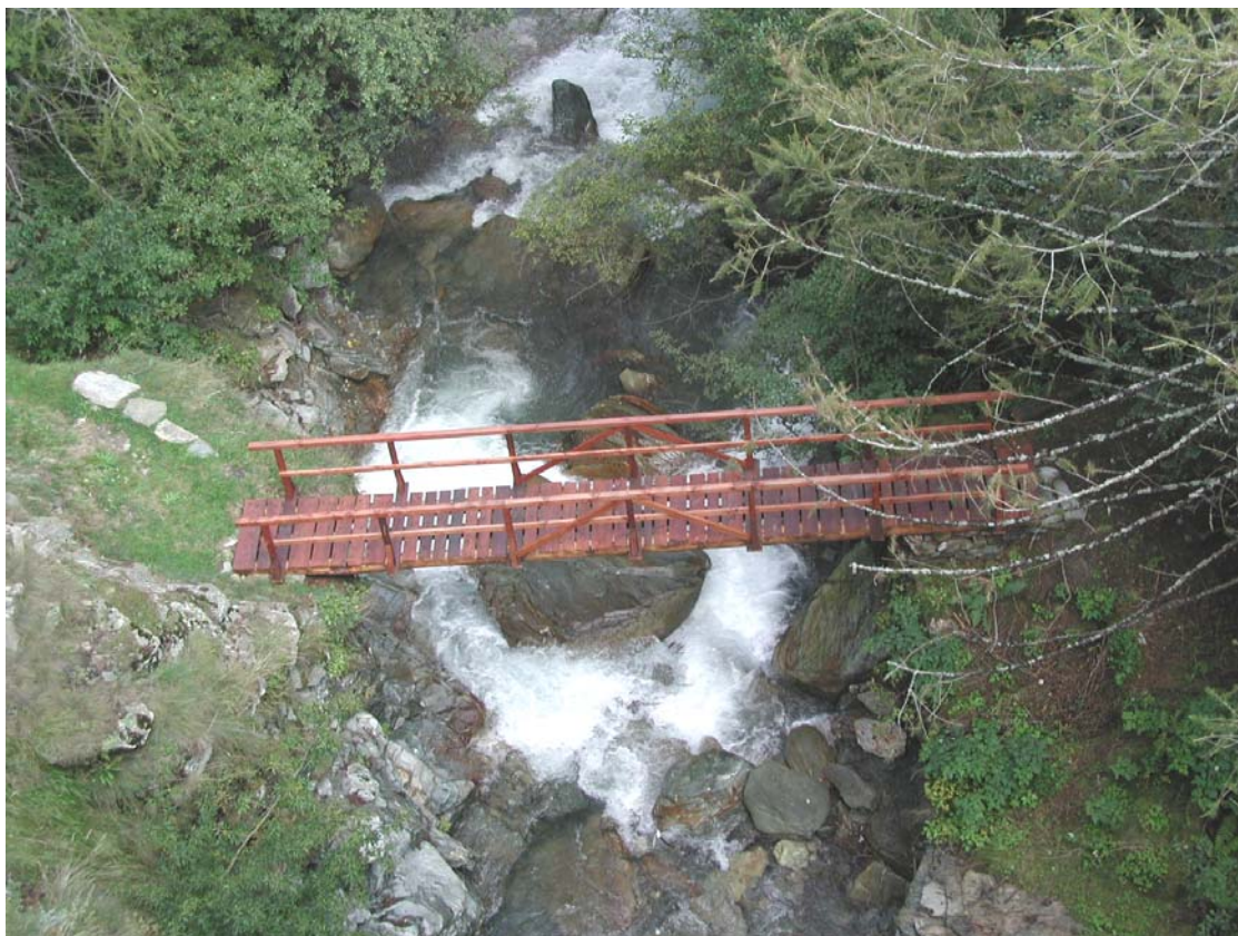
Foto 015 – Opera TREVPO015 . Da monte di fronte, dal ponte BATTPO014 .