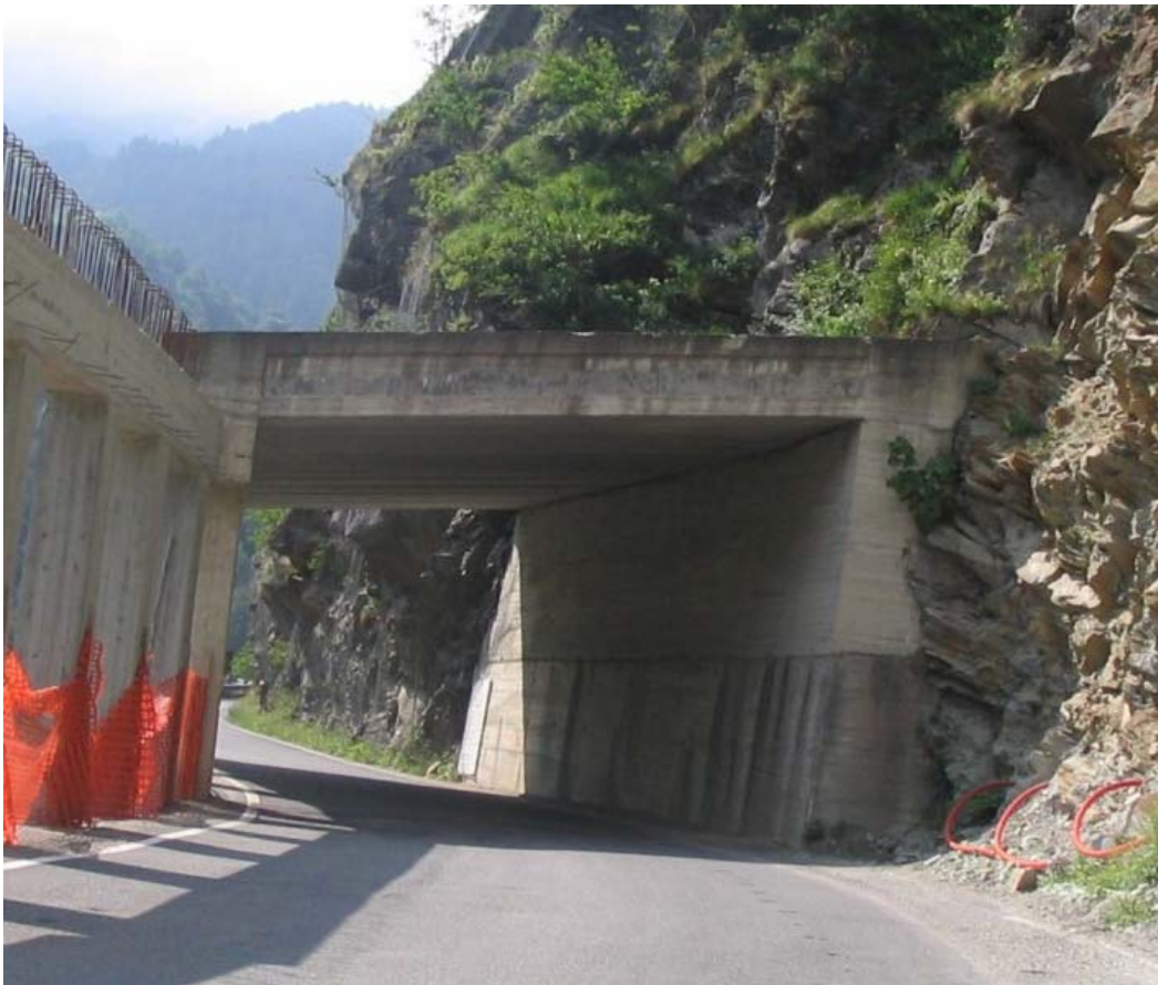
Foto 006 – Opera PENNPR005 . Ripresa da valle lungo la SS169 della Val Germanasca.