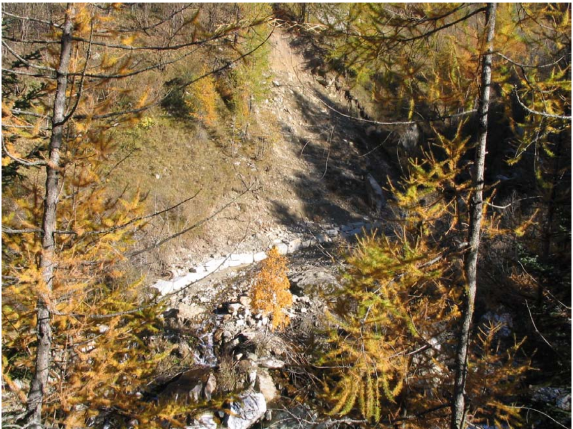
Foto 045 – Opera BATTDS046 . Ripresa da monte, sponda sinistra del T. Germanasca di Prali, in corrispondenza della confluenza con il Rio Maiera.