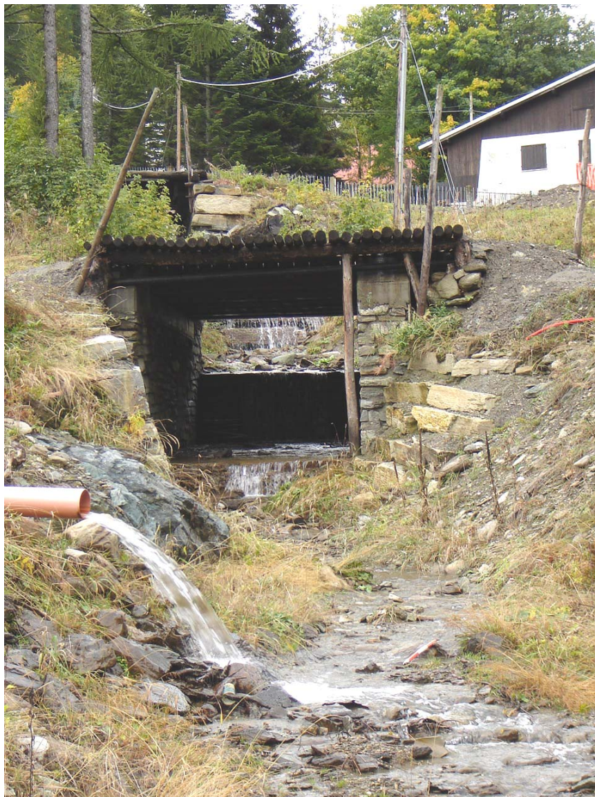
Foto 010 – Opera BATTAG017 . Ripresa da valle, sponda destra del rio affluente destro del T. Germanasca.