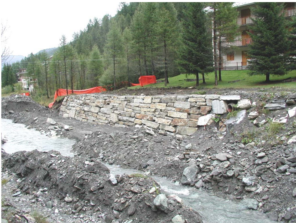
Foto 006 – Opera BATTDS006 . Da monte sponda sinistra del T. Germanasca.