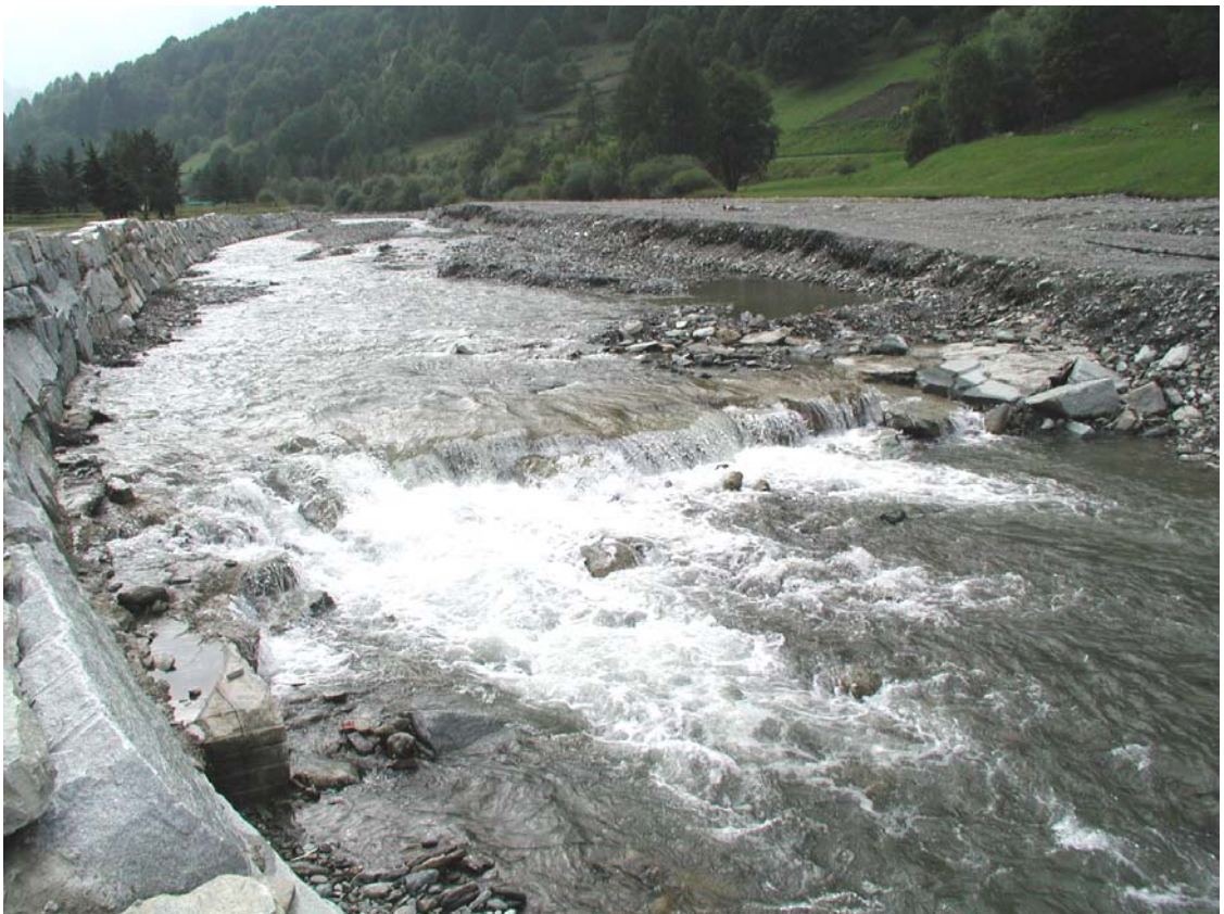
Foto 002 – Opera BATTSO002 . Da valle sponda destra del T. Germanasca.