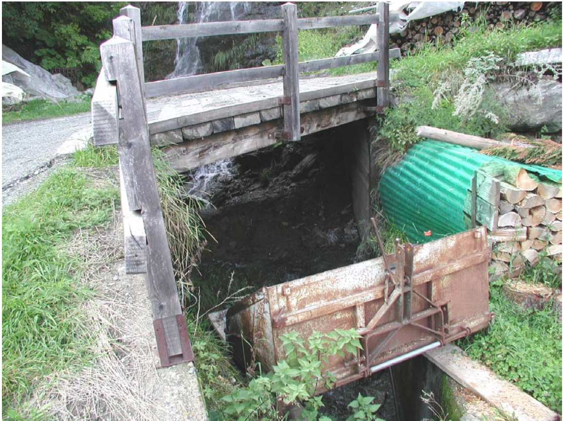
Foto 001 – Opera BATTAG001 . Da valle, sponda sinistra dell'affluente del Rio Comba Scura.