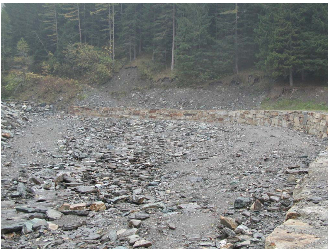
Foto 034 – Opera BATTDS037 . Ripresa da valle, sponda sinistra del Rio delle Miniere.