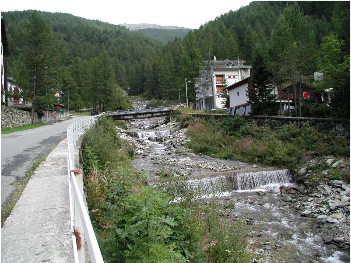
Foto 003 – Opere BATTBR003 , BATTBR007 e TREVR008 . Da valle sponda destra del Rio d'Envie.