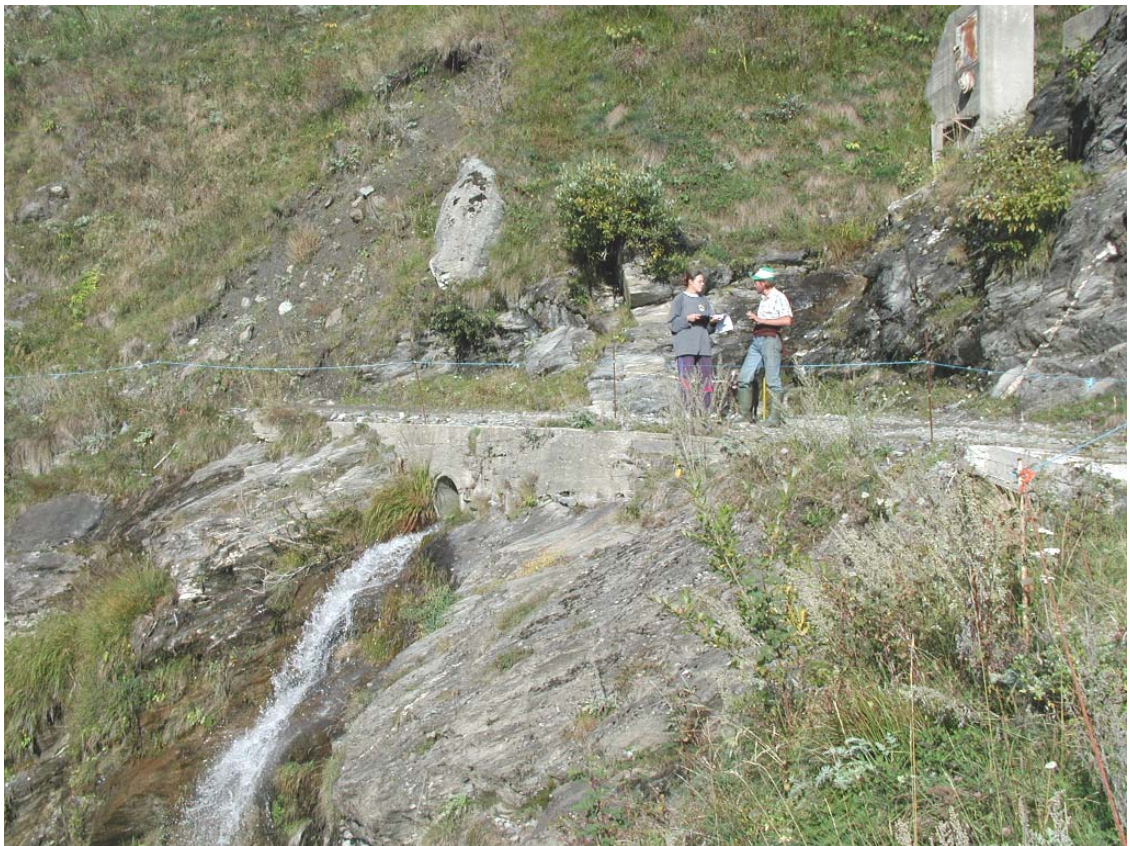
Foto 002 – Opera TREVAG007 . Dalla strada, in sponda destra del Rio Albournet.