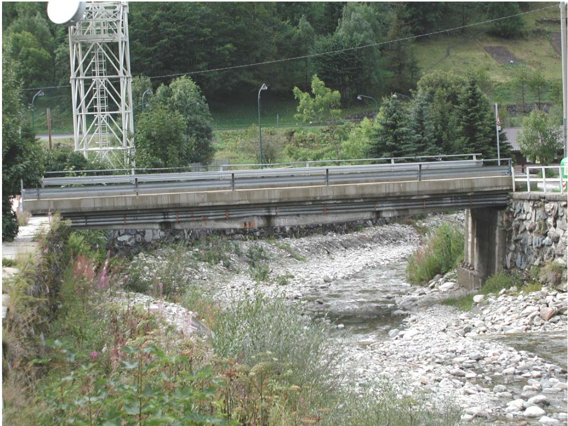
Foto 009 – Opera TREVPO009 . Da monte, sponda sinistra del Rio d'Envie.