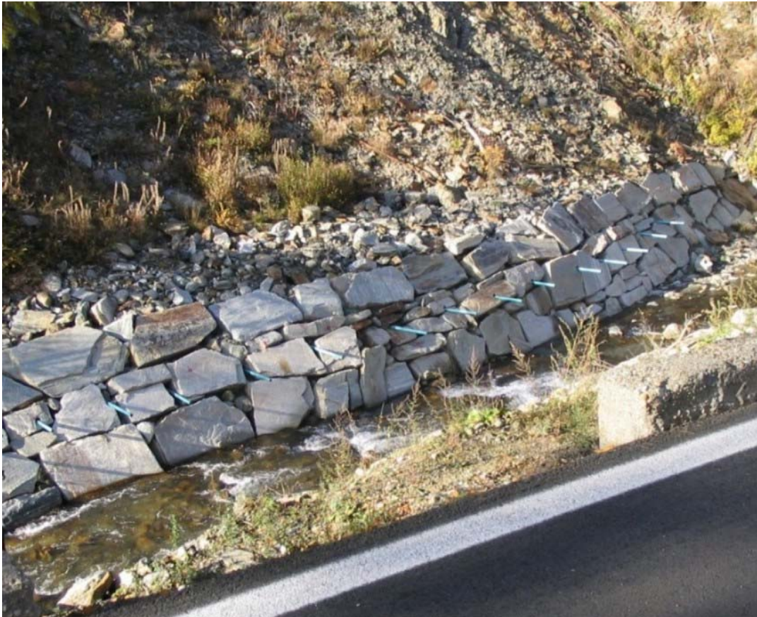
Foto 007 – Opera PENNDR002. Ripresa frontale, sponda destra del T. Germanasca.