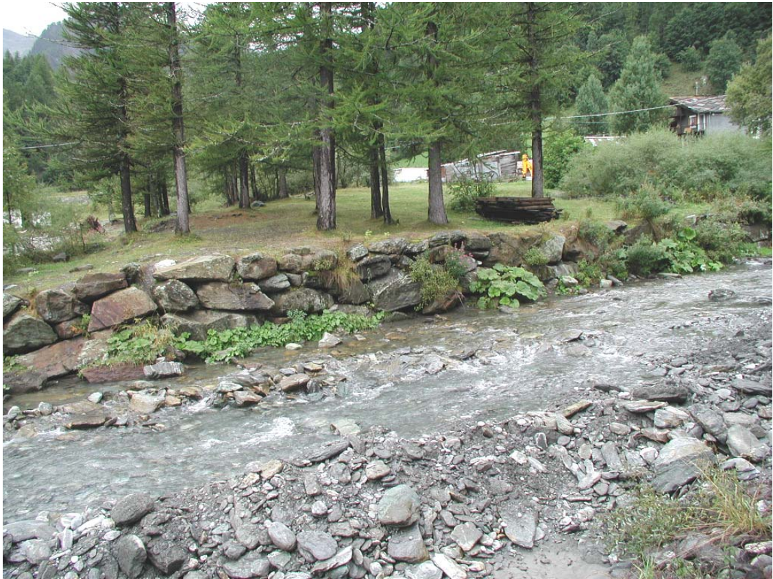
Foto 009 – Opera BATTDS009 . Di fronte, da sponda sinistra del Rio affluente del T. Germanasca.