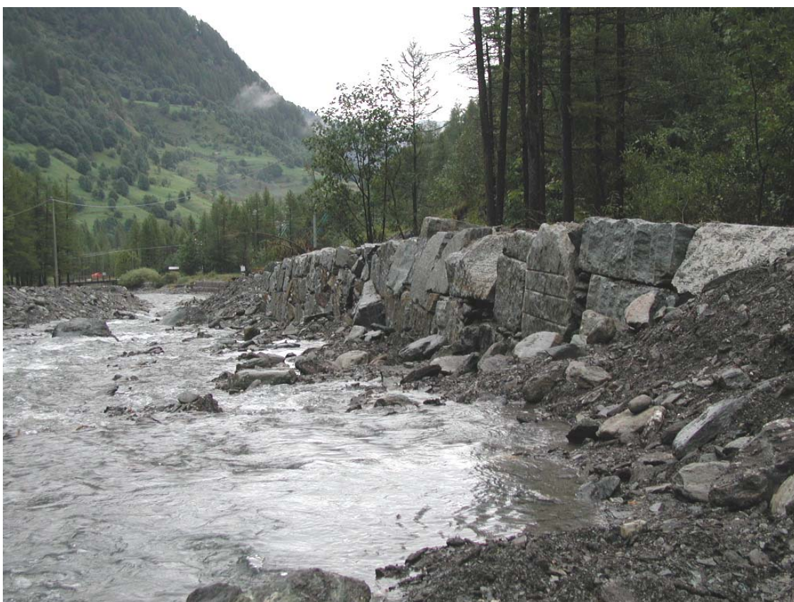
Foto 002 – Opera BATTDS002 . Da monte, sponda destra del T. Germanasca.