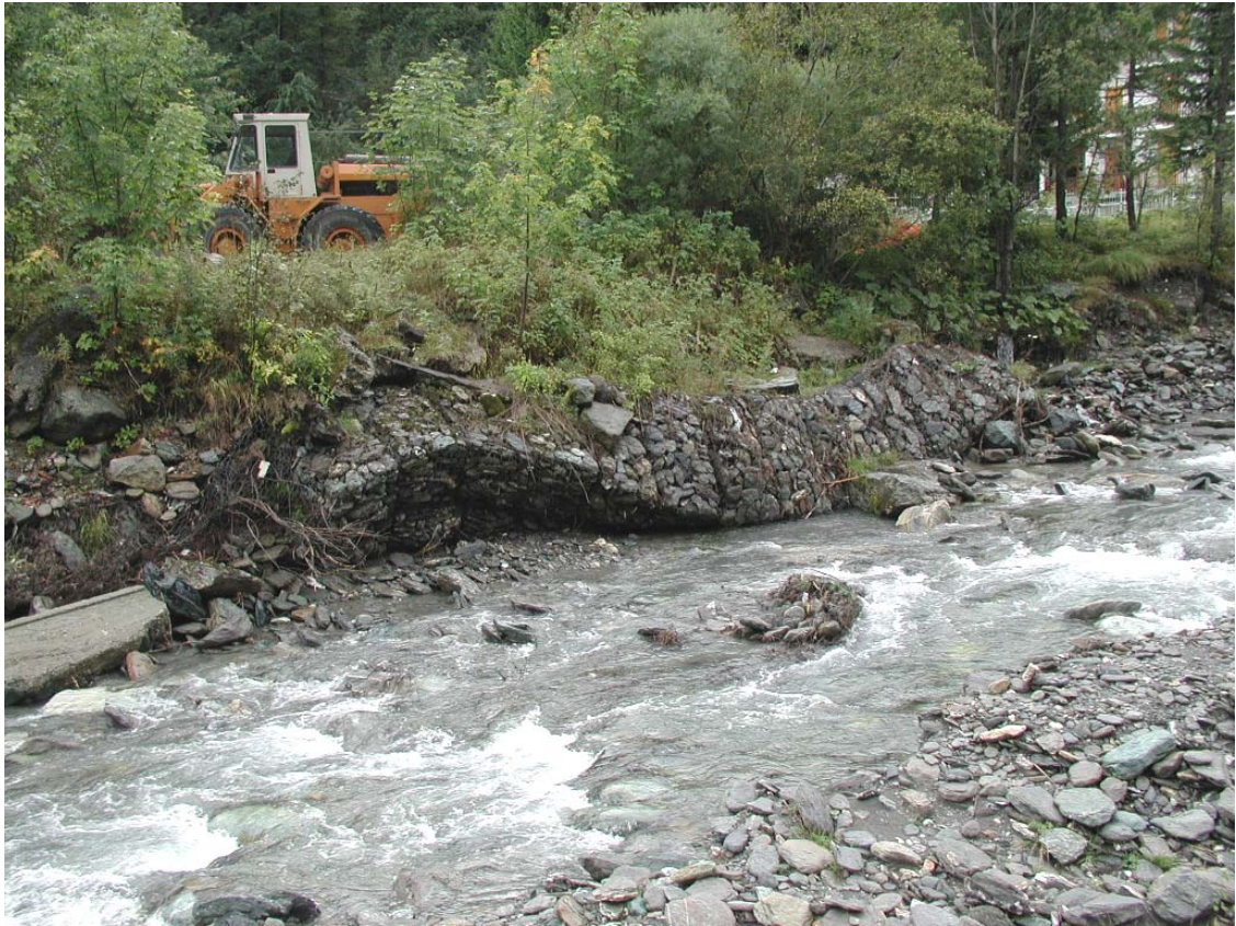
Foto 011 – Opera TREVDS011 . Da valle sponda destra del T. Germanasca.