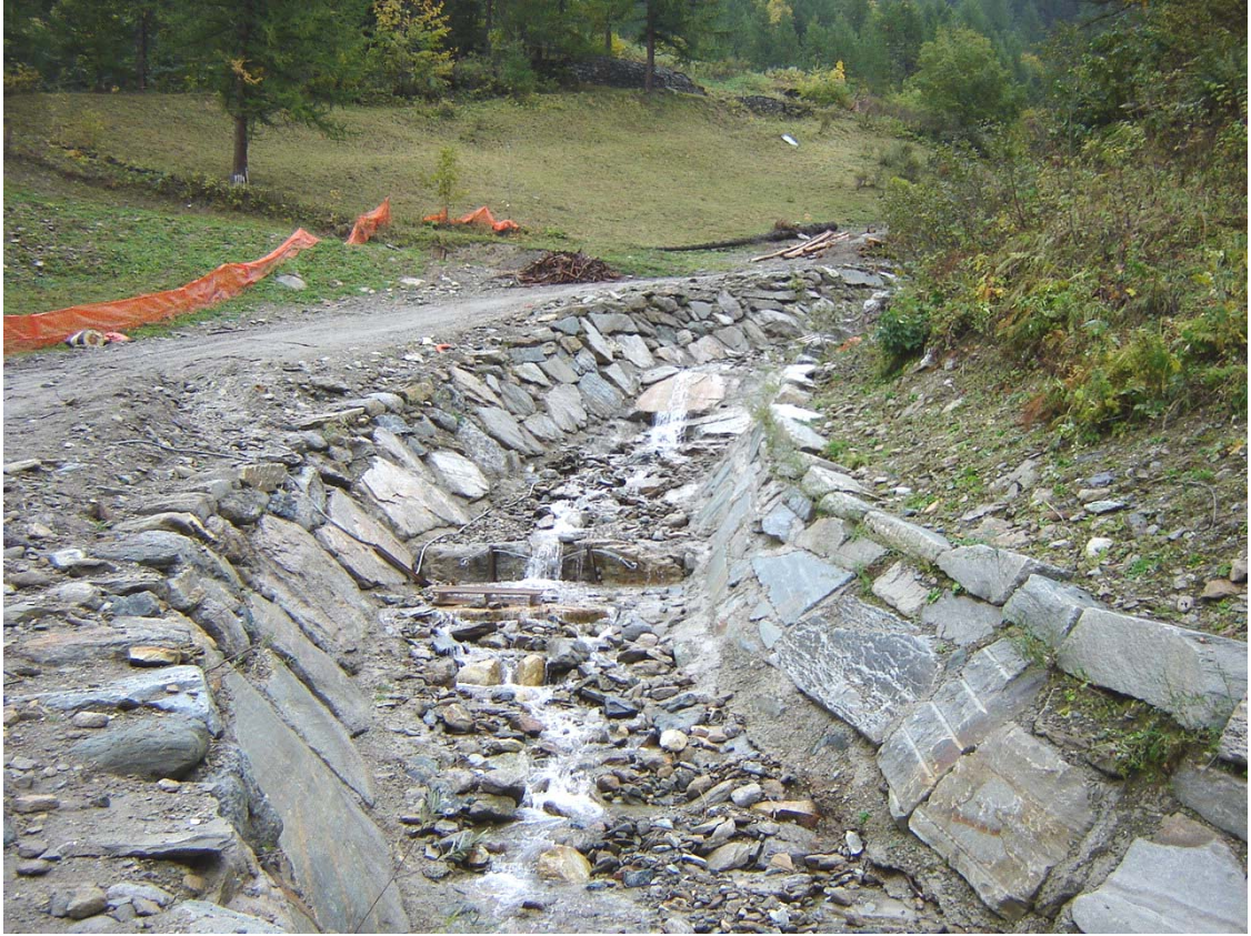
Foto 007 – Opera PENNCA009 . Ripresa da valle, sponda destra del Rio dell'Alpet.