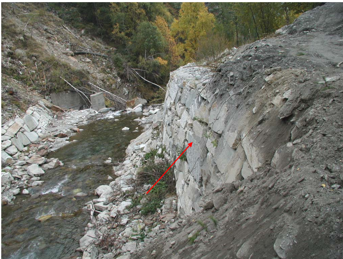
Foto 027 – Opera BATTDS028 . Ripresa da monte, sponda destra del T. Germanasca.