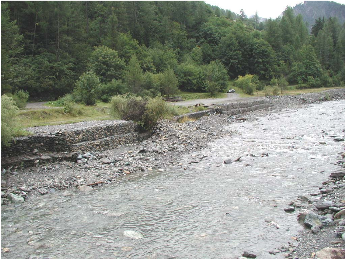
Foto 003 – Opera TREVDS003 . Da valle sponda sinistra del T. Germanasca.